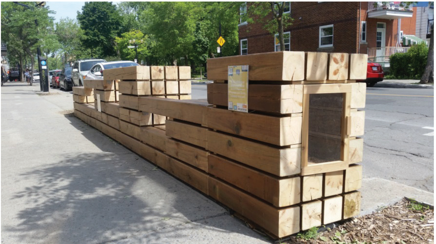
Placottoir Concertation Ville-Émard/Côte-Saint-Paul