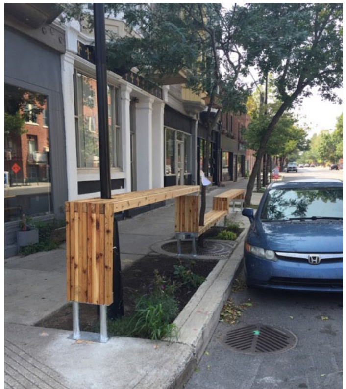
Placottoir Café Bloom (projet pilote)