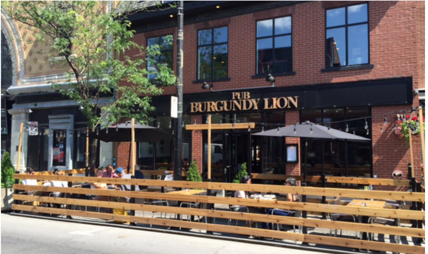
Pub Burgundy Lion