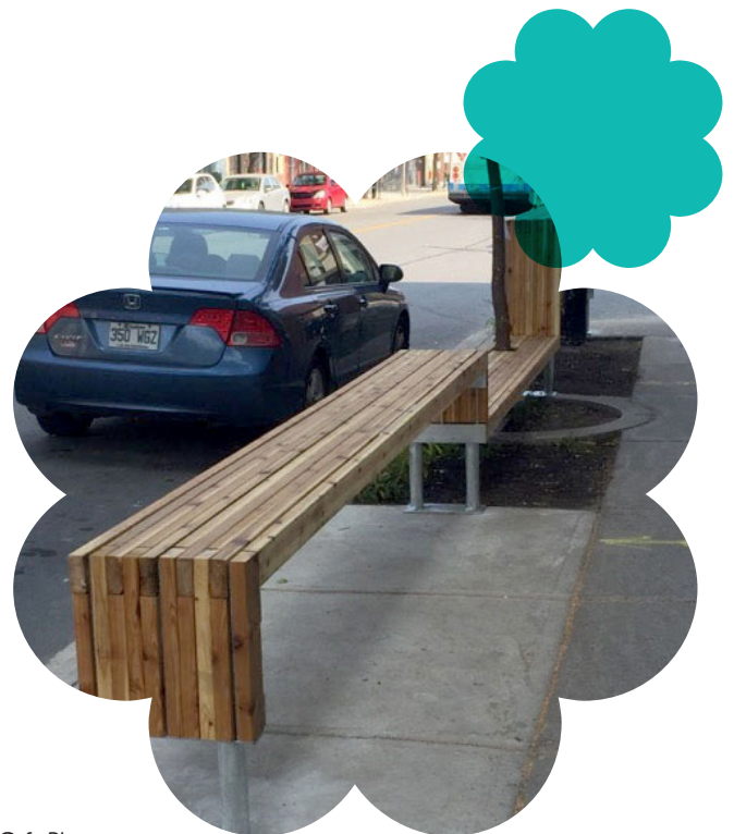
Placottoir Café Bloom

Le formulaire est disponible sur le site Internet de l'Arrondissement du Sud-Ouest dans la section Service aux citoyens, permis et autorisations .