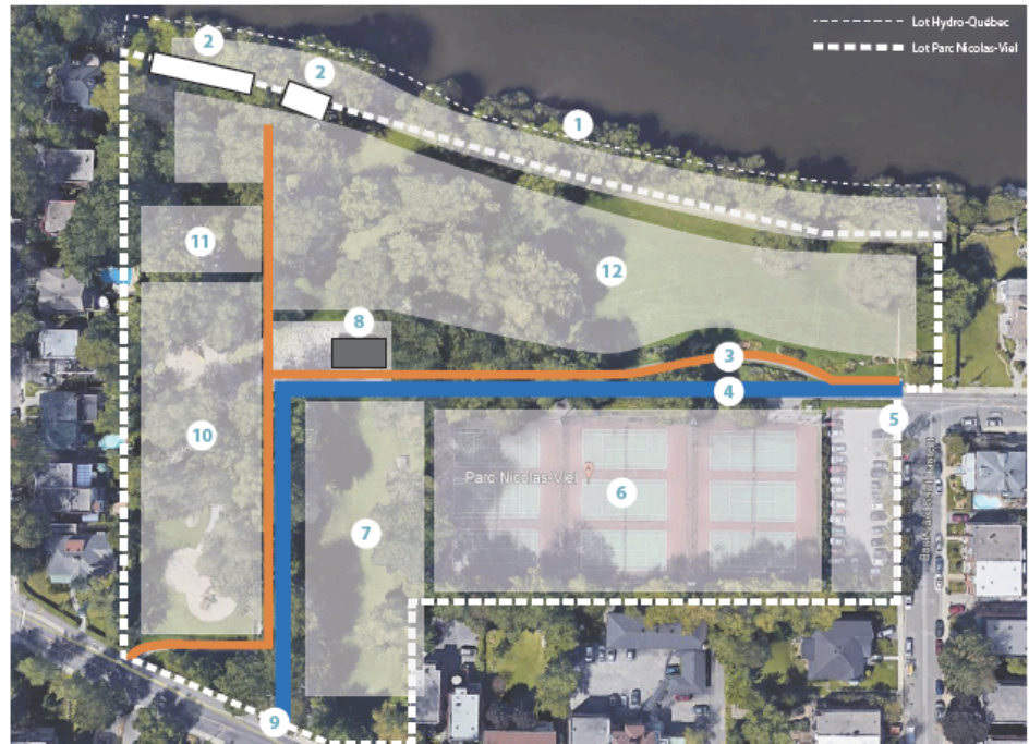
Carte présentant les différents secteurs ou zones du parc, à l'étude.