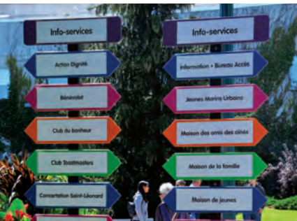
Les nouvelles enseignes de signalisation lors de la Fête du citoyen de 2017