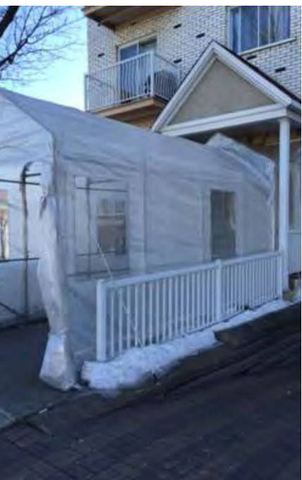
Un abri saisonnier reliant le domaine public à la porte du domicile