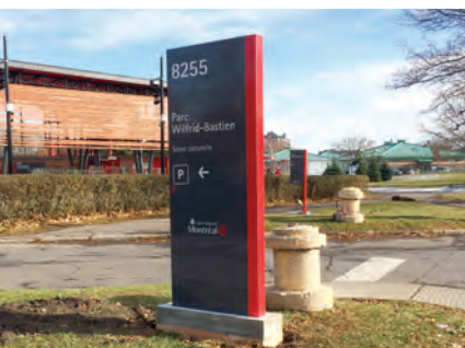
Un nouveau panneau d'identification au parc Wilfrid-Bastien

La Division des relations avec les citoyens et des communications a pour objectif d'informer, de sensibiliser et de promouvoir l'accessibilité universelle auprès des citoyens par une variété de moyens et d'outils adaptés, dont les médias substituts. Voici ses principales réalisations en 2017 :