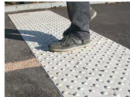
Une plaque podotactile