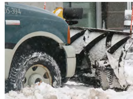
Un camion de déneigement de l'arrondissement