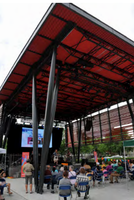
La scène culturelle de Saint-Léonard