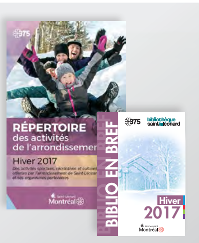
Les brochures des programmations d'activités de Saint-Léonard