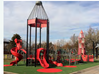
L'aire de jeux du parc Wilfrid-Bastien