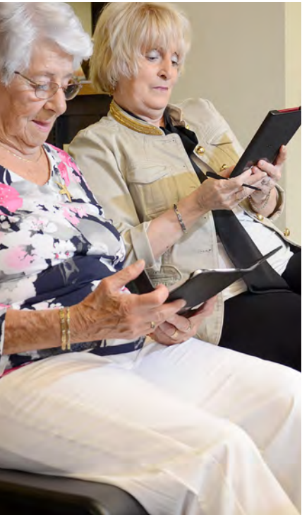
Prêt de liseuses numériques à la bibliothèque de Saint-Léonard

Plusieurs actions ont été concrétisées au cours de l'année 2017. Pour ce deuxième bilan, l'arrondissement de Saint-Léonard a choisi de dresser un aperçu des grands accomplissements et des bons coups réalisés par les quatre directions, selon les huit objectifs ciblés.