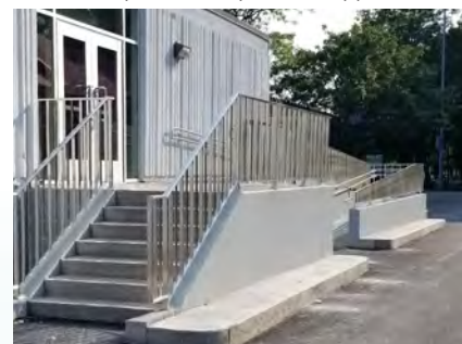
L'entrée du pavillon des baigneurs du parc Pie-XII