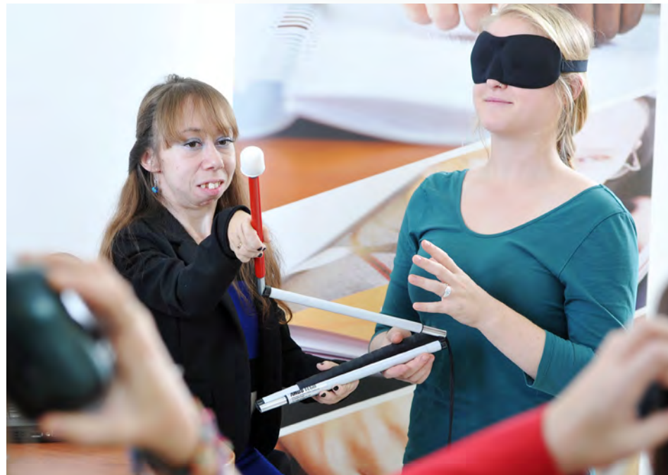
Une formation d'AlterGo