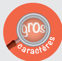
Le pictogramme identifiant les livres en gros caractères à la bibliothèque