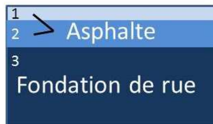
Conduites et entrées de service

Ce type de travaux d'entretien régulier est effectué à la surface de la chaussée . Environ 50 mm d'asphalte sont enlevés et remplacés lors de ces interventions rapides qui prolongent la durée de vie d'une rue de quelques années. Les entrées de service en plomb du côté public ne seront pas remplacées durant ces travaux, car ils sont habituellement situés à 1,8 mètre sous le niveau de la rue. En conséquence, il n'y aura aucune excavation, ni reconstruction des conduites d'aqueduc ou d'égout ou des trottoirs durant ces travaux. Si vous êtes locataire, veuillez faire suivre cet avis à votre propriétaire.