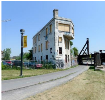
La tour d'aiguillage Wellington Projet signature En développement (pour 2018)