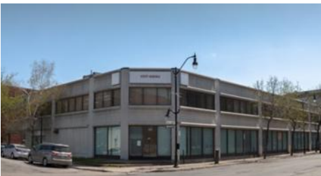
Le Sainte-Catherine, 3890-3910 Sainte-Catherine Est Location avec convention de rachat -- Depuis 2015 30 000 p.c., projet en démarrage- chantier (1,7M$)