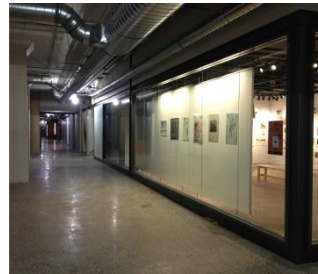
Pôle de diffusion, 5445-5455, avenue De Gaspé Gestionnaire de chantier – 2013-2014 17 000 p.c. (1,8M$)