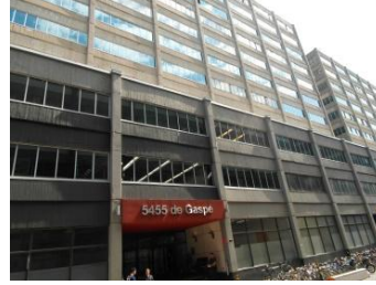
Pi2 De Gaspé, 5445, avenue De Gaspé, étages 3 à 6 Gestionnaire des opérations immobilières – depuis 2015 208 000 p.c., 130 ateliers/galleries, 475 usagers