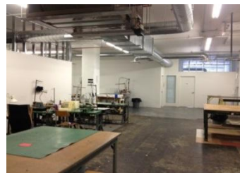
CouturOscope, 160, rue St-Viateur Est Location à long terme – depuis 2012 12 500 p.c., 24 ateliers, 40 usagers