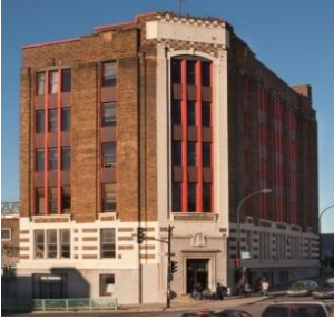
Le Bovril, 6201, avenue Du Parc Location à long terme -- Depuis 2013 15 000 p.c., 30 ateliers, 65 usagers