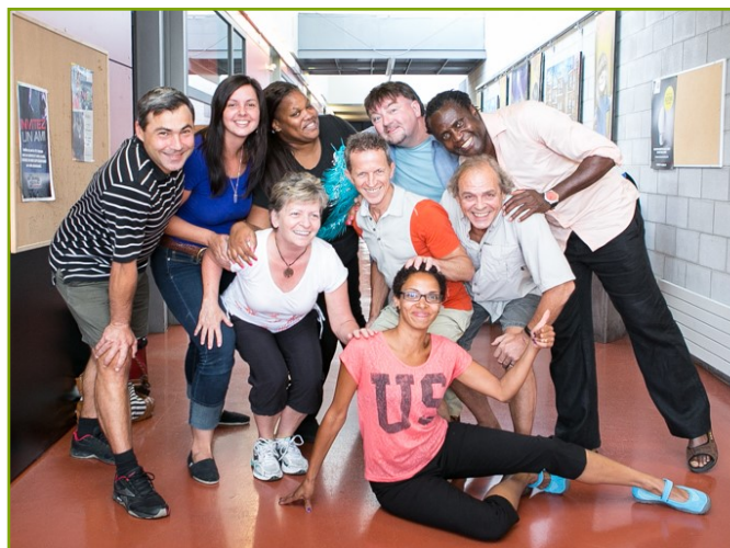
Équipe d'accompagnateurs du projet pilote — septembre 2014