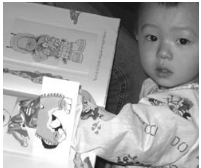
© Nathalie Martin, programme Contact, Ville de Montréal