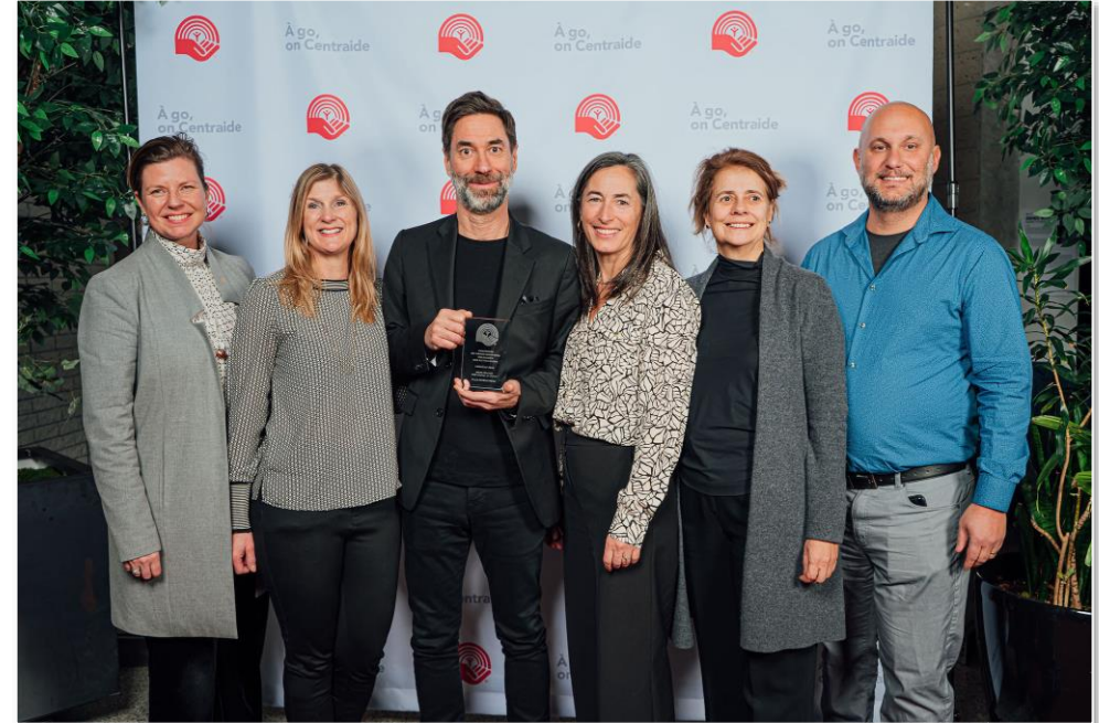
Photo prise lors du gala Les Solidaires, organisé par Centraide (remise du prix Mobilisation), en février dernier