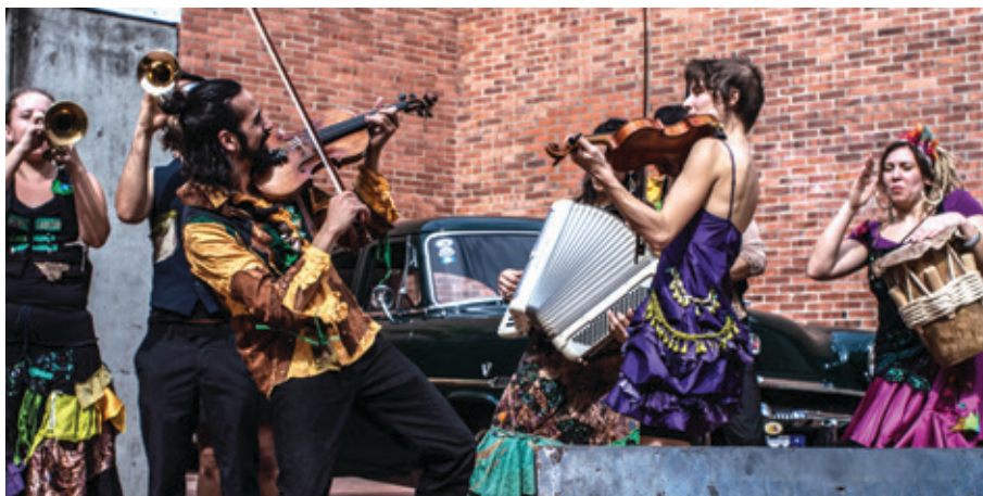
Gypsy Kumbia Orchestra © Adelaïda Pardo