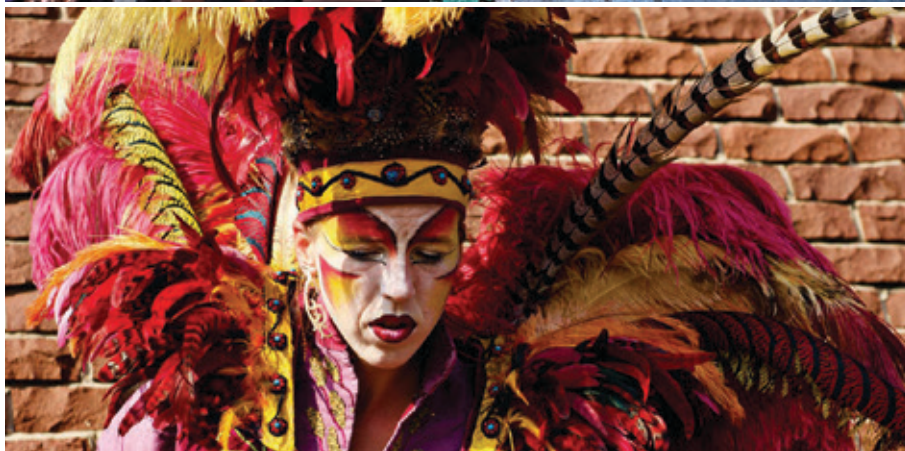
Les oiseaux © Les Chasseurs de rêves