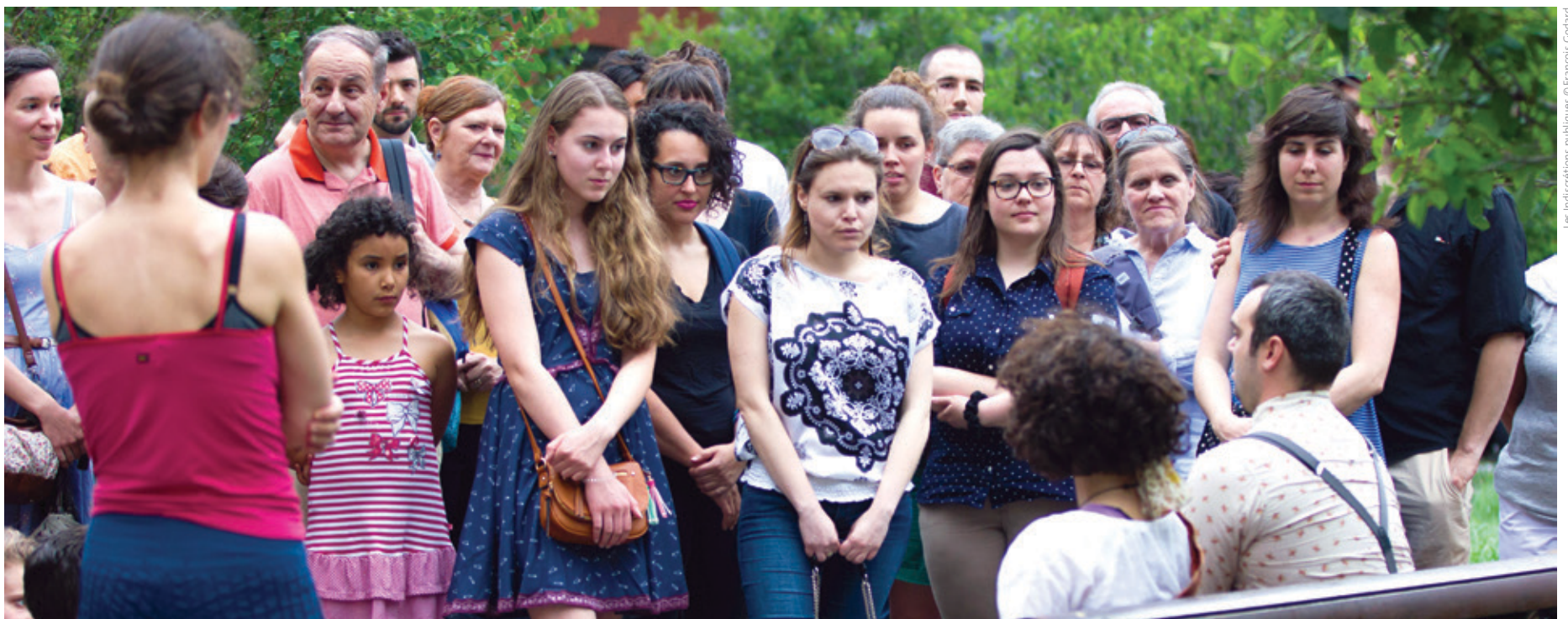
Les Indiscrétions publiques