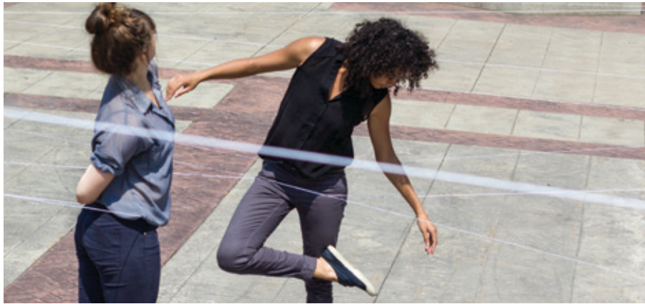
Entrelacs © Alt-Shift