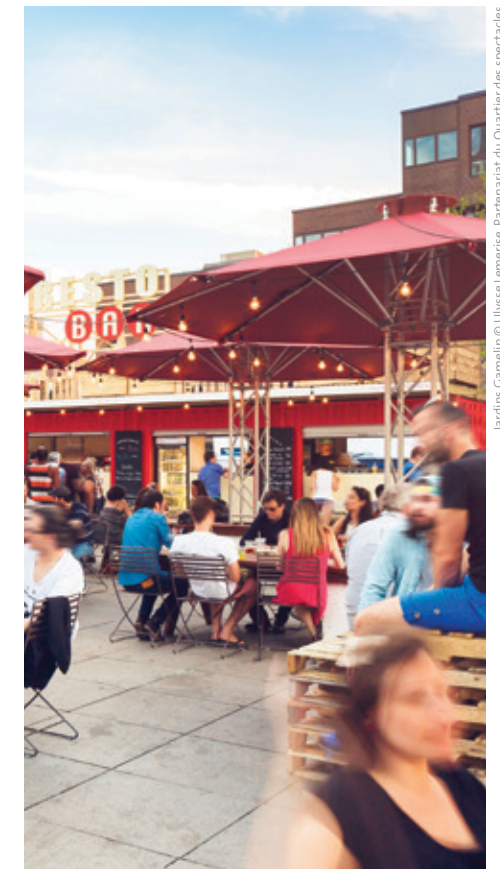
Jardins Gamelin