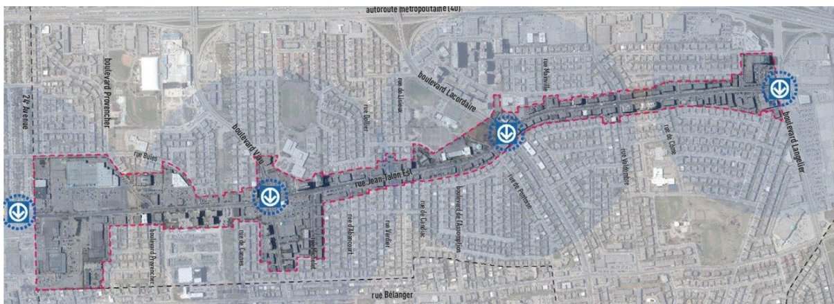
Carte du PPU Jean-Talon Est, avec les futurs édicules de métro.

Le secteur Jean-Talon couvre un regroupement de cinq arrondissements de l'est de Montréal. Étant donné ce positionnement, l'offre municipale, particulièrement en matière de loisir et culture, est particulièrement faible. En effet, le secteur ne comporte aucune salle de spectacle, bibliothèque, musée ou maison de la culture. Le service des bibliothèques recommandait dès 2010, qu'une bibliothèque soit construite dans ce secteur.