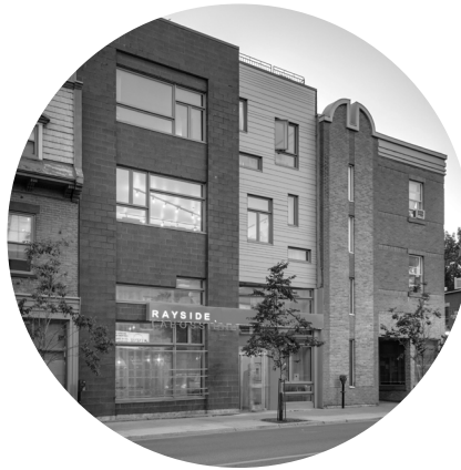
Rayside Labossière architectes