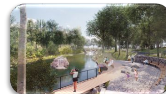
Étangs de la Grande Poudrière