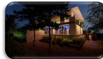
Pavillon de la Jamaïque