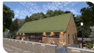
Chalet de la plaine des Jeux