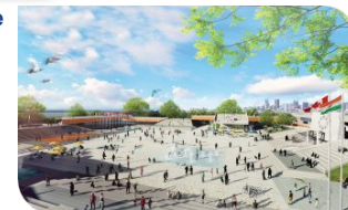
Place des Nations