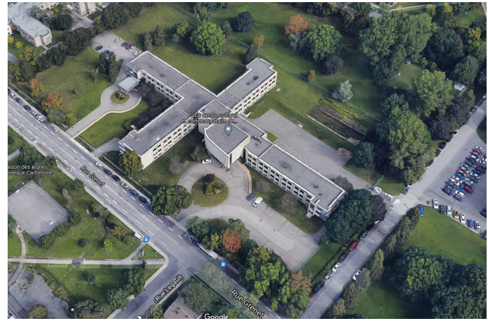
À gauche : Zone d'intervention dans son contexte urbain (en rouge) / À droite : Site de la résidence Notre-Dame-de-la-Providence