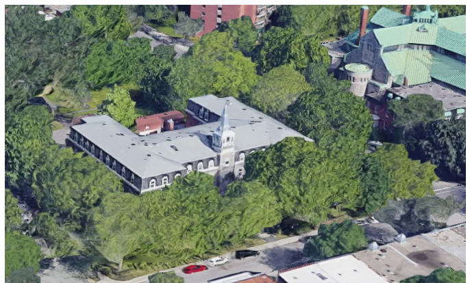
Site de l’ancien couvent Sainte-Émélie