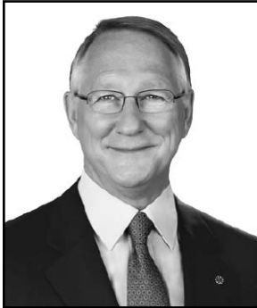
Gérald Tremblay Maire