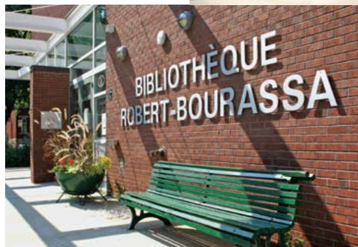
Bibliothèque Robert-Bourassa (Outremont) Denis Vézina