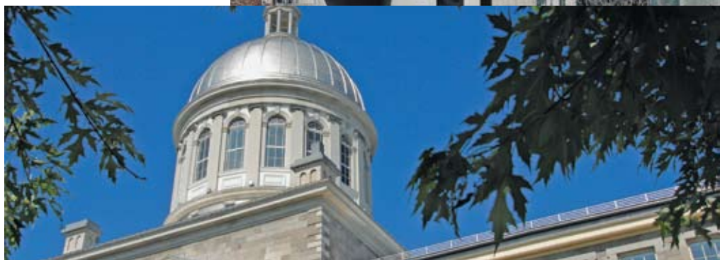
Marché Bonsecours Le photographe masqué