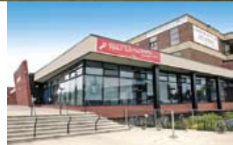
Bibliothèque Georges-Vanier (Sud-Ouest) Denis Vézina