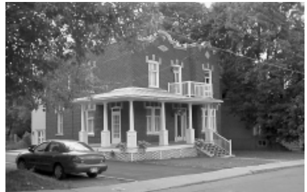
10.1.2 Avenue L'Archevêque

Dans ce secteur fort hétérogène, il ne subsiste à peu près plus de bâtiments d'intérêt patrimonial ailleurs que sur l'avenue L'Archevêque. On y retrouve quelques maisons villageoises, des maisons urbaines de la seconde moitié du XIX e siècle à un ou deux étages et des constructions de l'après-guerre. Même si les transformations successives aux bâtiments ont eu pour effet de restreindre l'intérêt patrimonial du secteur, l'atmosphère du bourg y est toujours perceptible, avec ses rues courtes se terminant parfois en cul-de-sac, la topographie naturelle en pente vers la rivière des Prairies, la végétation mature (exceptionnelle sur le boulevard Albert-Brosseau) et les percées visuelles sur la rivière et sur l'ancien village de Saint-Vincent-de-Paul.