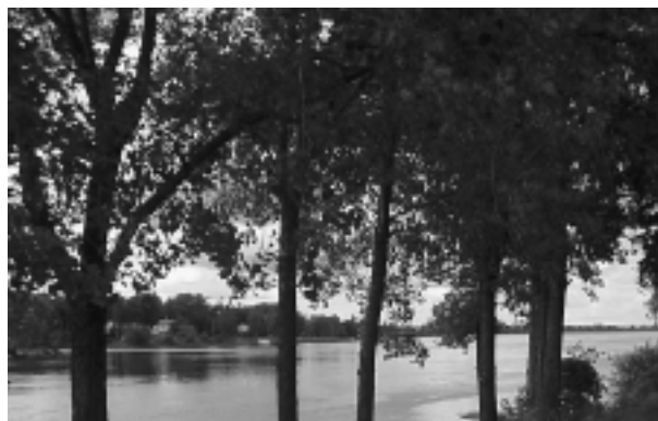
10.1.1 Vue sur la rivière des Prairies