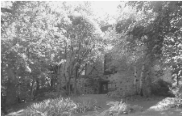
10.1.1 La maison Andegrave (Drouin-Xénos), au 5460, boulevard Gouin Est