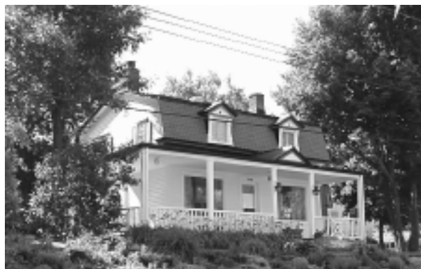
10.1.1 Le 5730, boulevard Gouin Est