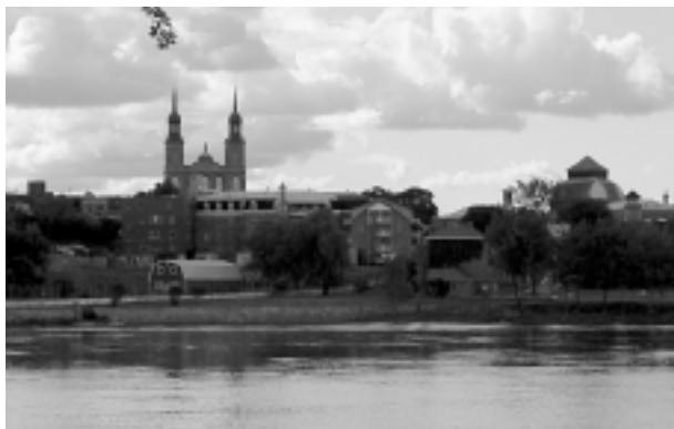
10.1.1 Vue sur l'ancien village de Saint-Vincent-de-Paul

fort hétérogène. On retrouve de nombreuses insertions contemporaines aux modes d'implantation variables qui n'ont aucun autre souci d'intégration que de maintenir un gabarit relativement constant. Il faut aussi mentionner, à l'ouest du secteur, un ensemble institutionnel de la période moderne présentant un intérêt architectural certain : l'Hôpital Marie-Clarac, œuvre de l'architecte J.-P. Cantin, et l'Institut Marie-Clarac.