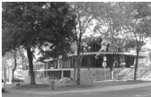
10.1.1 Hôpital Marie-Clarac