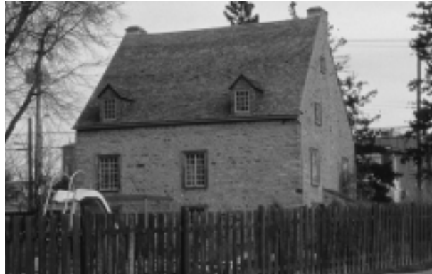
BJFJ-019 Le site de la maison Casal.

archéologiques découverts au cours de travaux d'aménagement réalisés sur la propriété en 1984 ont été datés de la première moitié du XIX e siècle.