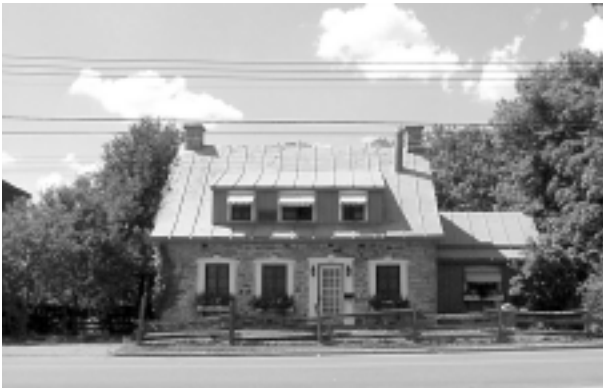
10.1.1 La maison L'Archevêque, au 4065, boulevard Gouin