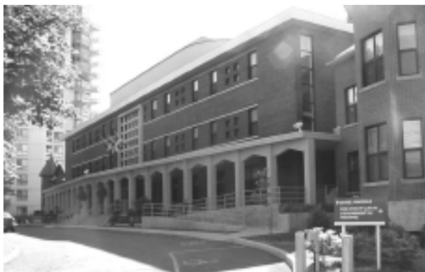
10.1.1 École Marie-Clarac