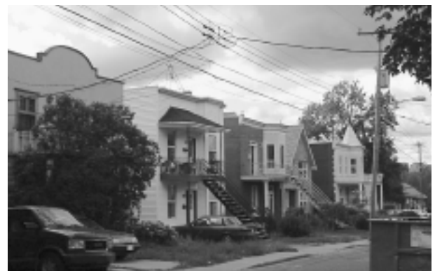
10.1.2 Avenue L'Archevêque