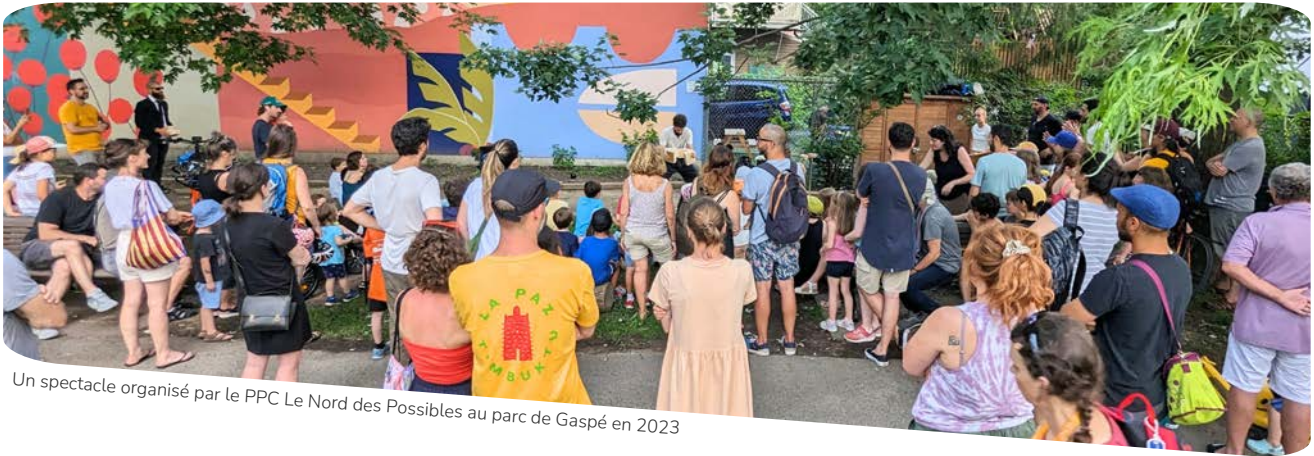
Un spectacle organisé par le PPC Le Nord des Possibles au parc de Gaspé en 2023