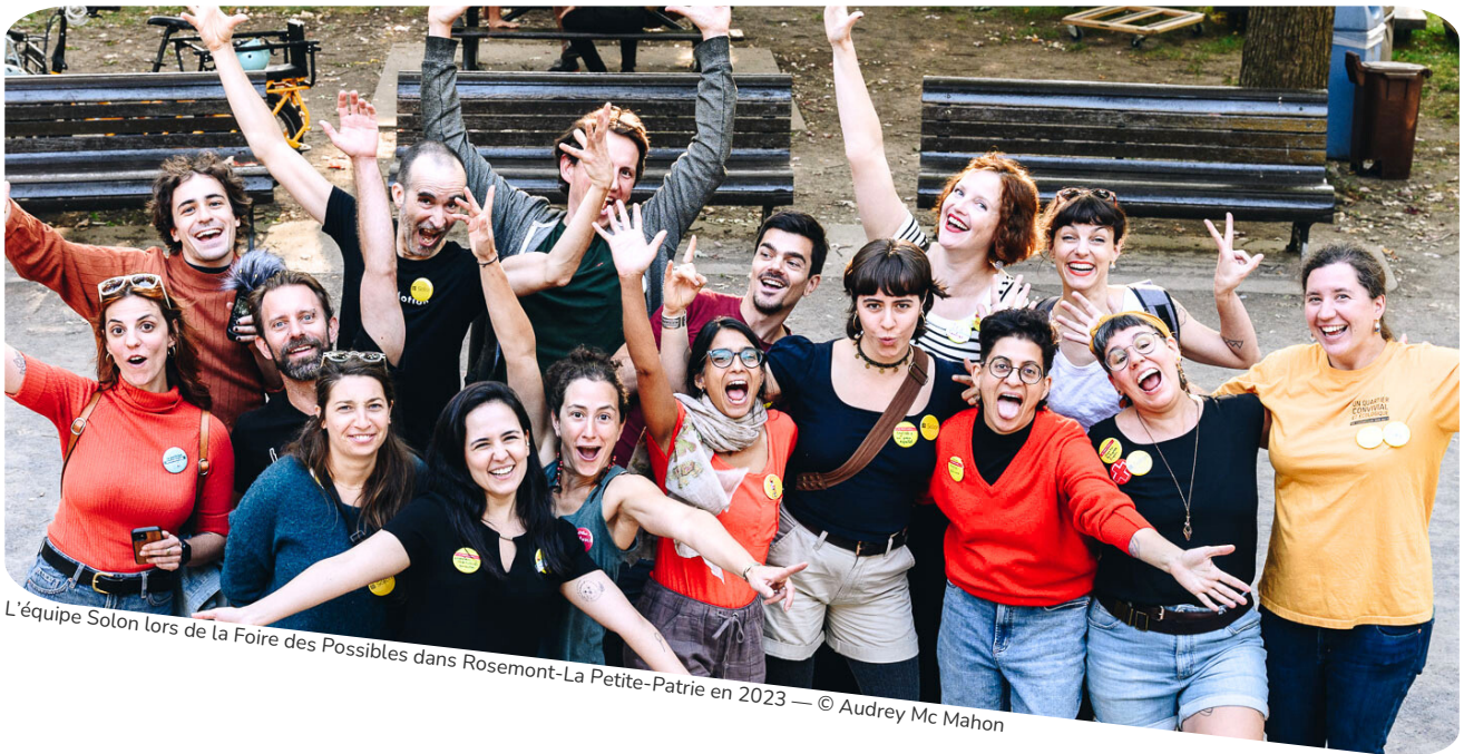
L'équipe Solon lors de la Foire des Possibles dans Rosemont-La Petite-Patrie en 2023