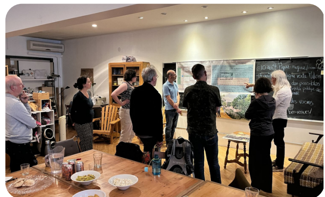
Activité de structuration pour le projet Ligne verte Millen