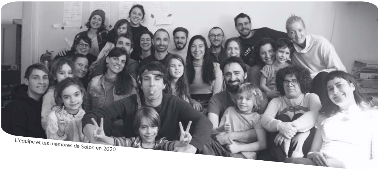
L'équipe et les membres de Solon en 2020