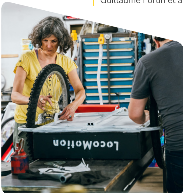
Fabrication de LocoMobiles

Des plans en libre partage ont même été conçus bénévolement par Guillaume Fortin et améliorés par plusieurs membres de LocoMotion!