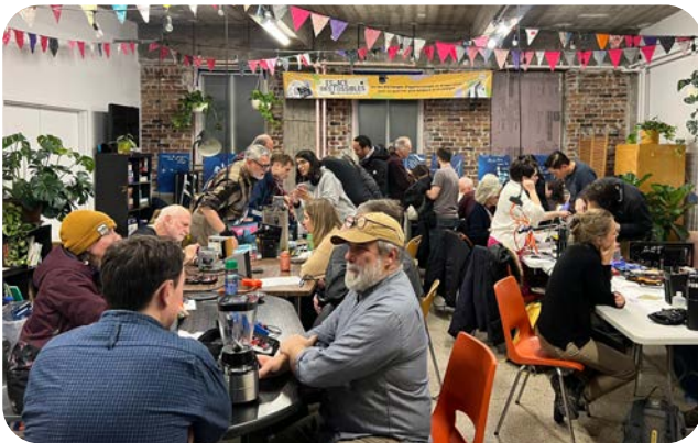
Un repair café à l'Espace des Possibles de La Petite-Patrie