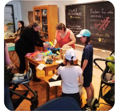
Une soirée Troc tes trucs entre voisin-es à l'EdP d'Ahuntsic

On accompagne la création de tiers-lieux, des espaces communautaires autogérés par les résident-es des quartiers où ils sont implantés. Chaque tiers-lieu inspire et fait vivre des initiatives locales et solutions adaptées aux besoins de son quartier.