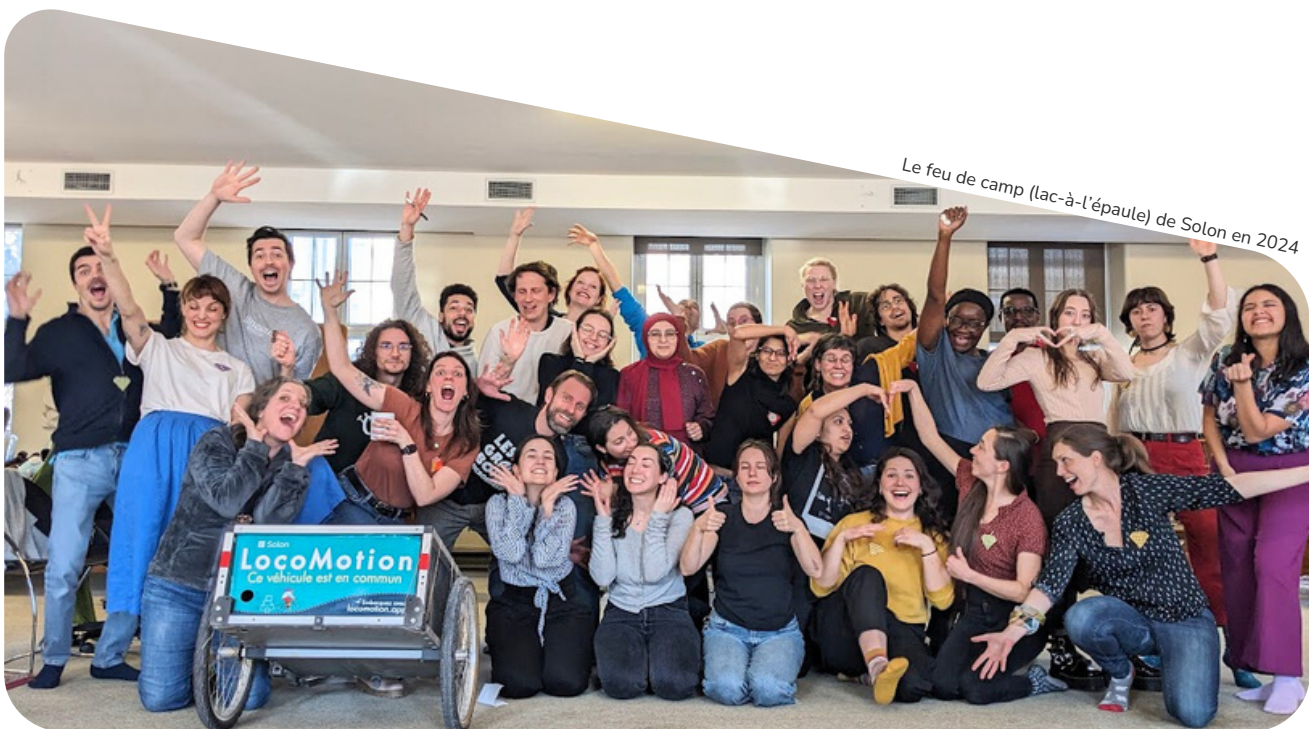
Le feu de camp (lac-à-l'épaule) de Solon en 2024