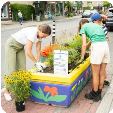
Saillies citoyennes dans Ahuntsic-Cartierville

On encourage la mobilité active, partagée et collective pour une ville en santé, en sécurité et inclusive. On travaille sur la transformation d'espaces dédiés à la voiture en lieux conviviaux.