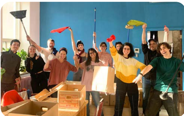
Le déménagement aux ATSE rénovés en novembre 2023