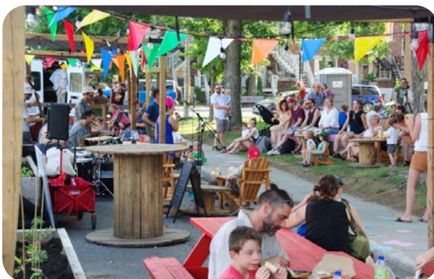
Soirée d'ouverture de la programmation estivale à la Station Youville

En tant que gagnant du Prix de la transition du concours CASES , le projet a bénéficié d'un soutien financier de 10 000 $ et d'un accompagnement. En septembre 2023, une chargée en mobilisation de Solon a accompagné le groupe citoyen sur différents plans : structuration de la démarche, soutien à la mobilisation, communications.