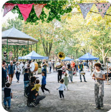
3e édition de la Foire des Possibles dans La Petite-Patrie

On soutient les quartiers, les organismes et les citoyennes qui les composent dans leur transition socio-écologique et on organise des événements favorisant le partage de bonnes pratiques fondées sur les apprentissages ou l'expertise.