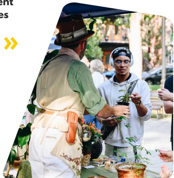
Atelier de plantation à la Foire des Possibles 2023

Nous accompagnons les groupes citoyens et les institutions dans la construction d'une ville plus écologique et solidaire , un quartier à la fois.