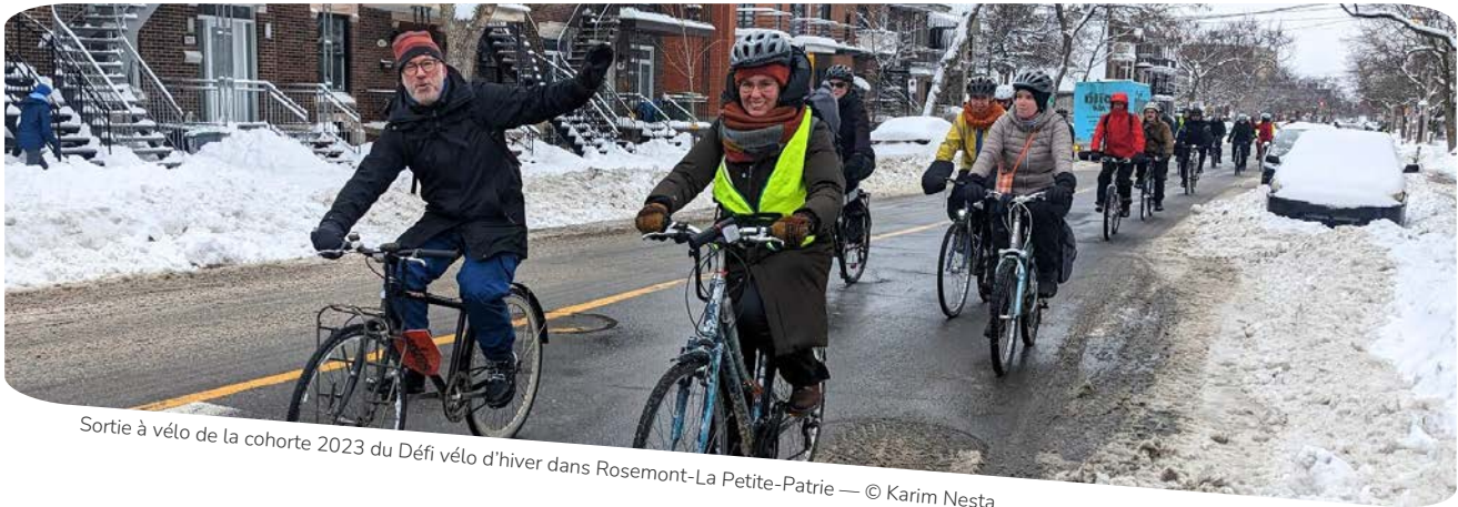
Sortie à vélo de la cohorte 2023 du Défi vélo d'hiver dans Rosemont-La Petite-Patrie