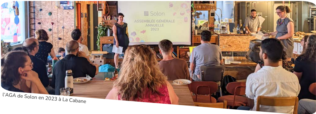
l'AGA de Solon en 2023 à La Cabane