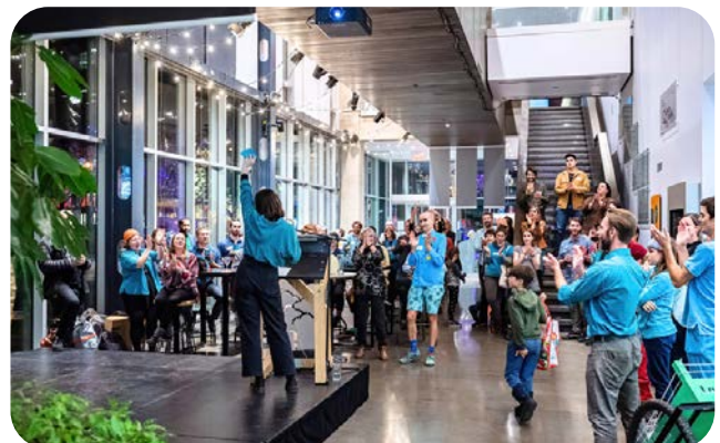
L'annonce de la création de l'OBNL au Gala LocoFolies