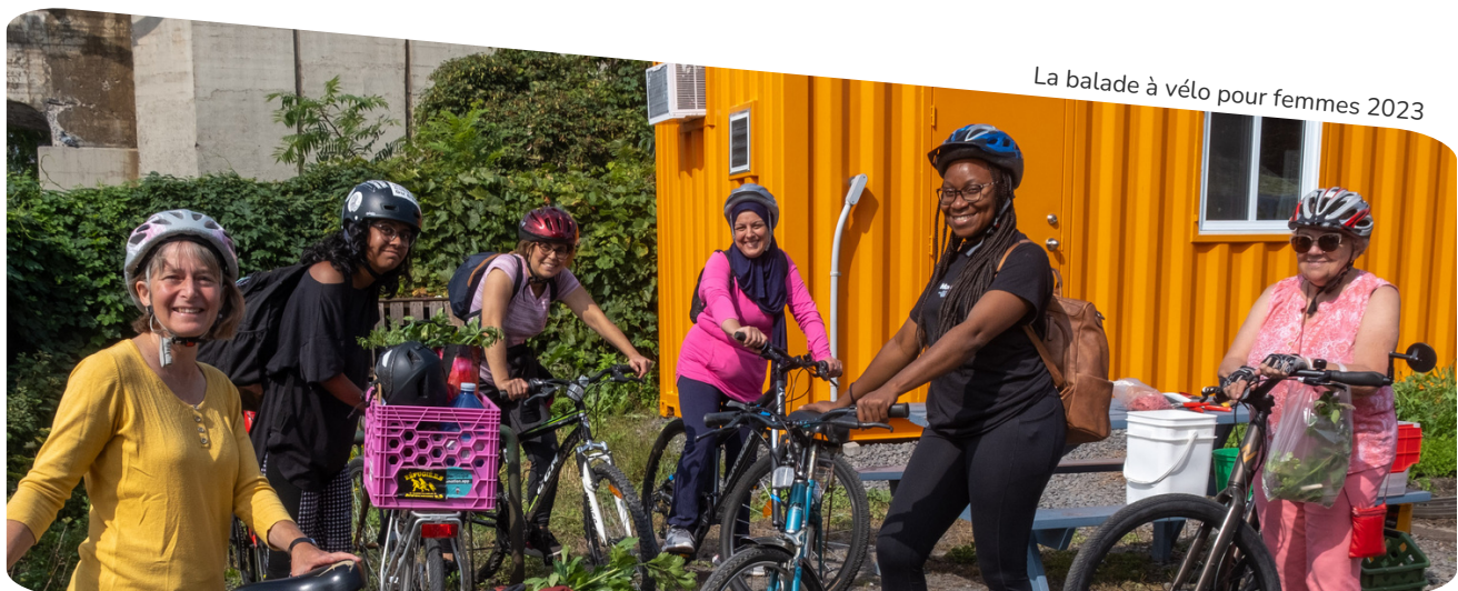
La balade à vélo pour femmes 2023

Après ce diagnostic et la construction d'un plan d'action par le comité EDI, nous avons testé différentes approches à travers nos champs d'activités, et des stratégies ont émergé, qui sont résumées dans notre démarche EDI .