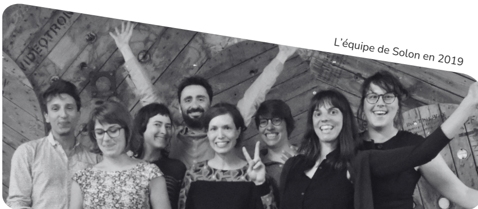
L'équipe de Solon en 2019