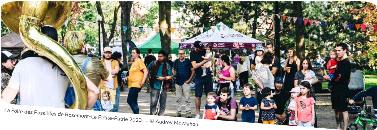
La Foire des Possibles de Rosemont-La Petite-Patrie 2023