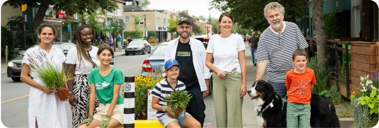
Activité de plantation pour les saillies citoyennes

Solon a encadré l'approche participative, le processus de co-création et de mobilisation, en s'appuyant sur notre ancrage dans le quartier. Notre équipe a agi comme intermédiaire entre les différentes parties prenantes.