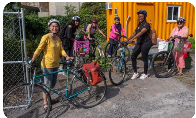
Participant aux balades à vélo pour toutes