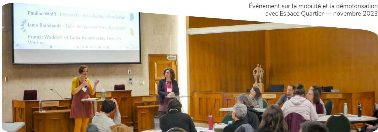
Événement sur la mobilité et la démotorisation avec Espace Quartier — novembre 2023