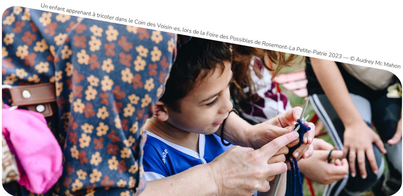
Un enfant apprenant à tricoter dans le Coin des Voisin-es, lors de la Foire des Possibles de Rosemont-La Petite-Patrie 2023

Ils donnent du pouvoir : ce sont des outils qui favorisent la participation et l'implication des gens! Ils déconstruisent certains récits négatifs sur l'action collective et démontrent qu'ensemble, on peut gérer nos ressources autrement, en se basant sur l'intelligence collective et le partage. Ils sont essentiels pour construire une société décroissante, axée sur le bien-être des êtres vivants, qui respecte les limites de la planète et qui garantit un avenir désirable pour toutes et tous.