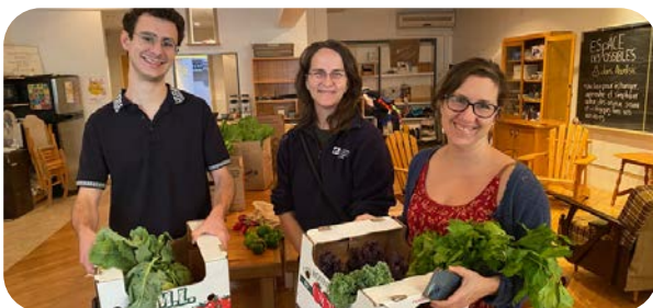
Bénévoles du collectif d'achat de l'Espace des Possibles Ahuntsic