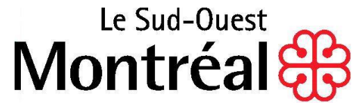
Table de concertation VÉCSP

Le Centre collabore avec l'Arrondissement dans divers comités et rencontres. Notre équipe de coordination participe à plusieurs comités comme la Table des camps de jour, la table des loisirs, les rencontres ponctuelles sur des enjeux du secteur, etc.