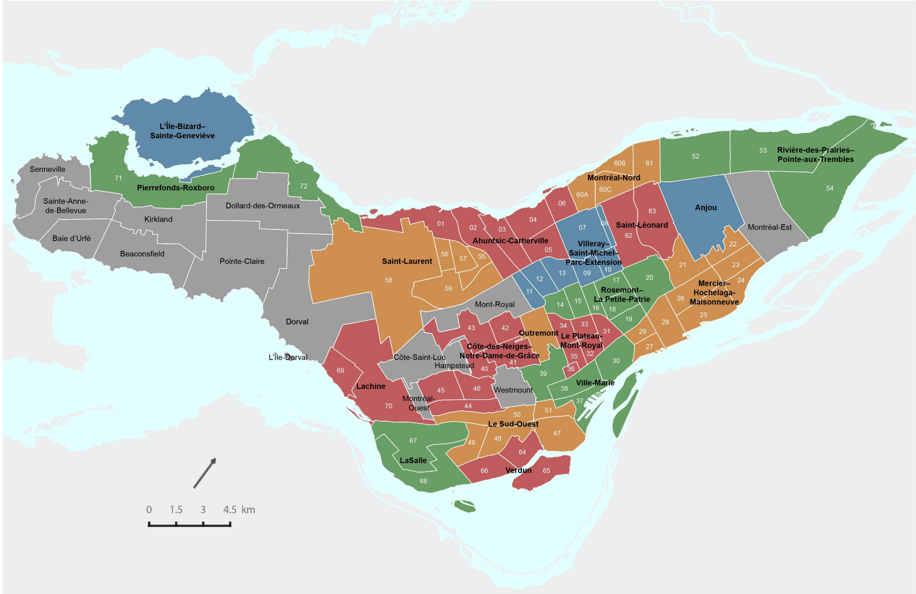
Cartographie : Service de la mise en valeur du territoire.