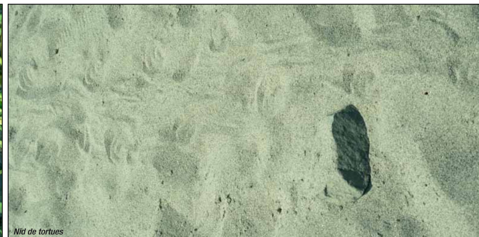
Nid de tortues