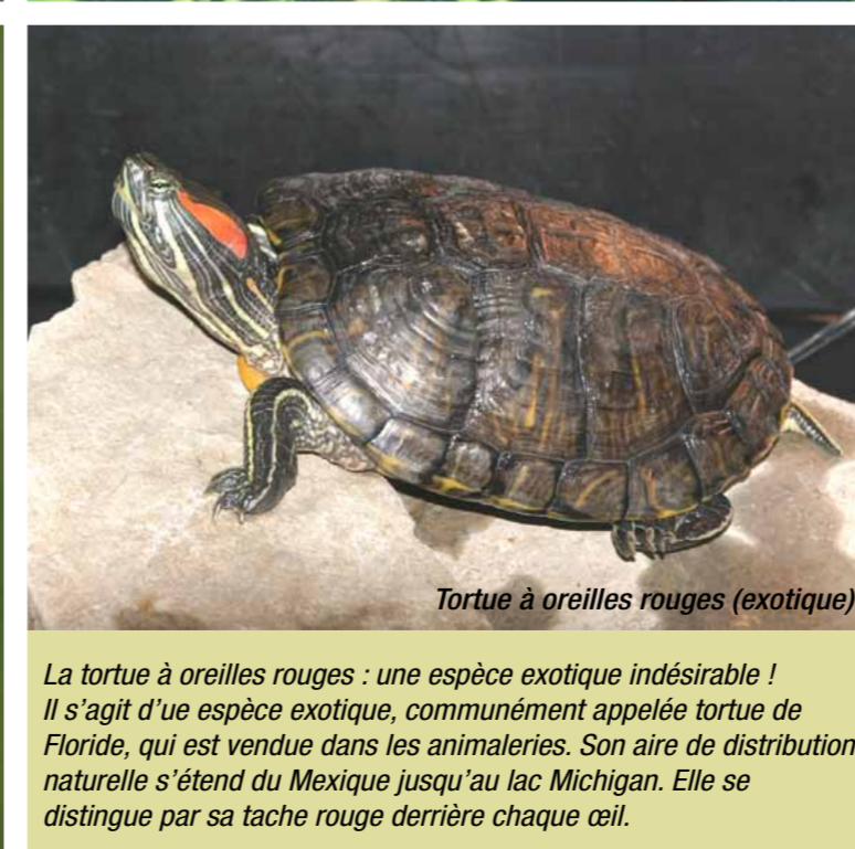
Tortue à oreilles rouges (exotique)

La tortue à oreilles rouges : une espèce exotique indésirable ! Il s'agit d'une espèce exotique, communément appelée tortue de Floride, qui est vendue dans les animaleries. Son aire de distribution naturelle s'étend du Mexique jusqu'au lac Michigan. Elle se distingue par sa tache rouge derrière chaque œil.