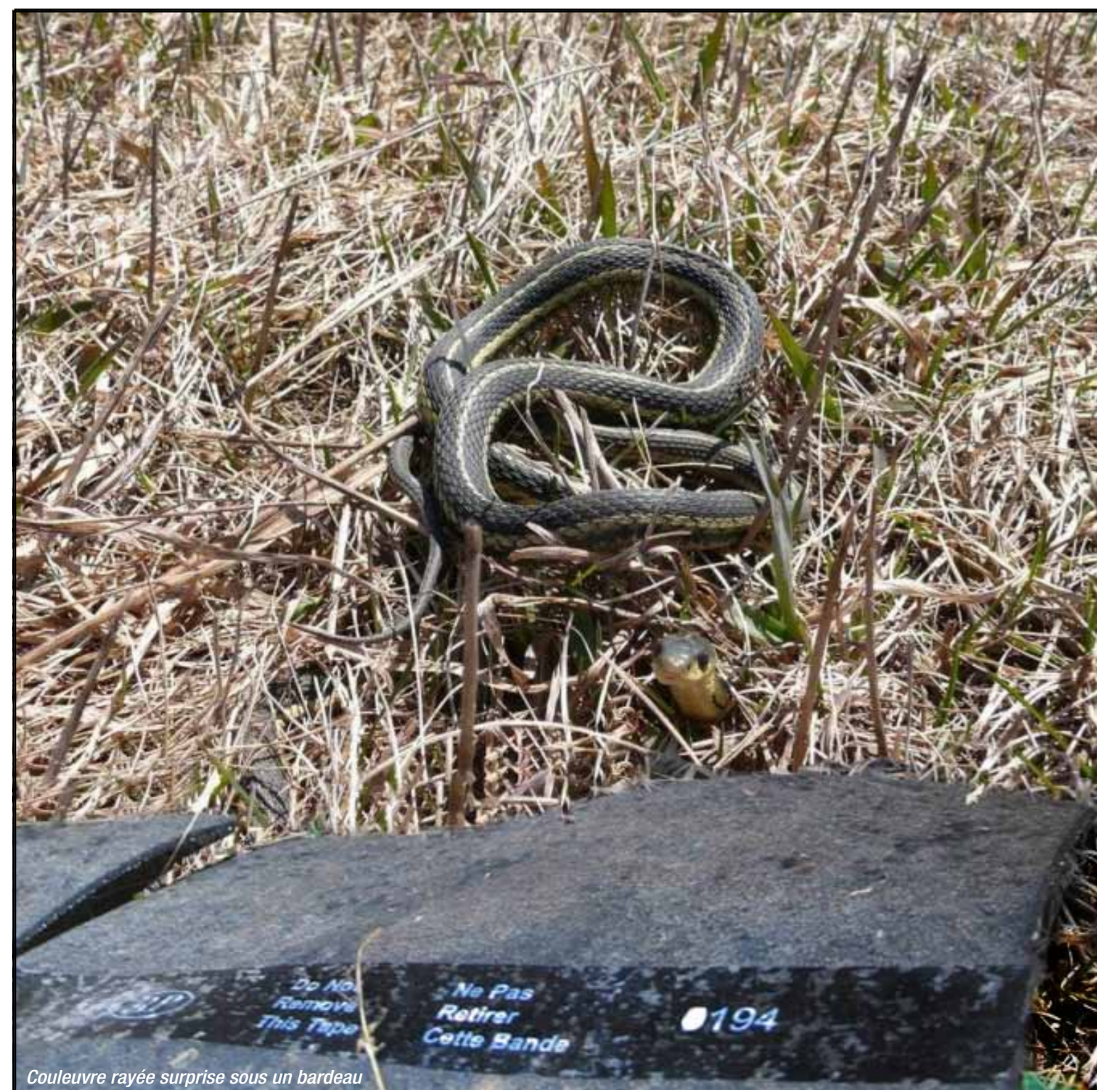
Couleuvre rayée surprise sous un bardeau