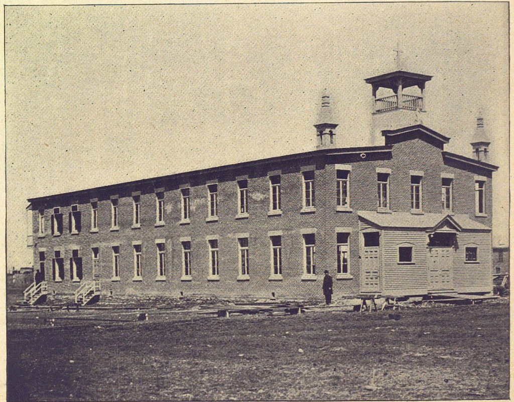
EGLISE DE SAINT-EDOUARD DE MONTREAL.

Le 3 mai suivant, la construction étant terminée, Mgr Fabre en faisait la bénédiction solennelle, au milieu d'une assistance nombreuse. Une magnifique messe en musique fut exécutée par le