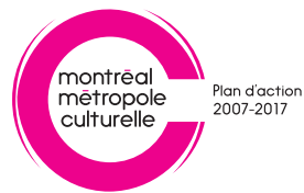
Logo partenaire horizontal noir et blanc