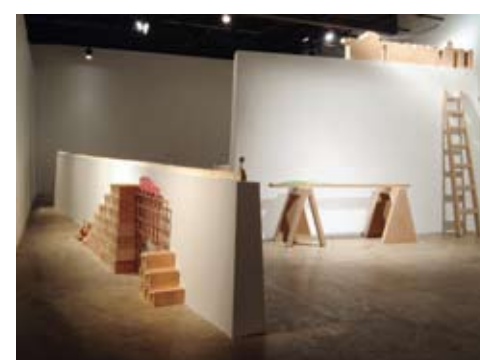
Jean-Philippe Roy, Le paysage opaque, 2008

Pour chaque nouvelle exposition, l'artiste aborde l'espace de la galerie comme un territoire à explorer et à marquer d'une poésie d'objets, d'images et de mots rechargés de sens. Intéressée par l'idée de la mobilité des objets et des idées, l'artiste revisite notamment des objets tronqués qu'elle aime prolonger, comme elle le fait avec l'espace de la galerie, pour y inscrire des mythologies personnelles.