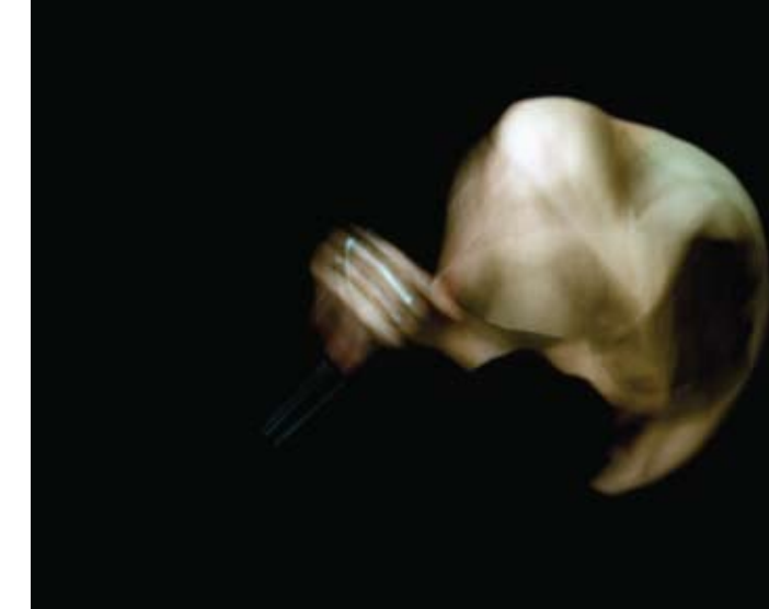
Sylvie Moisan, Hybride 115, 2008