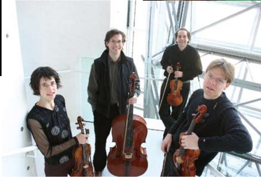
Quatuor Saint-Germain