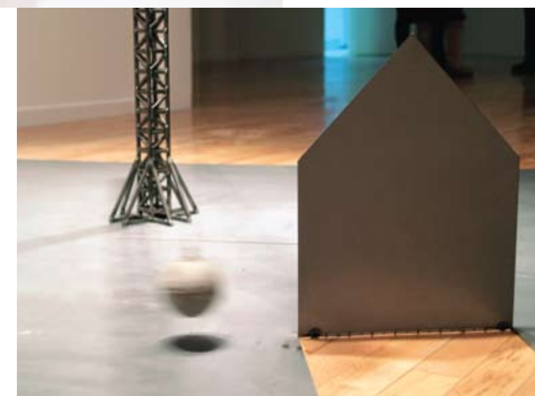
Ariane Lord, Embrasser la routine (détail), 2009