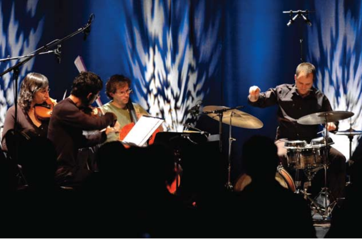
Tour de Bras