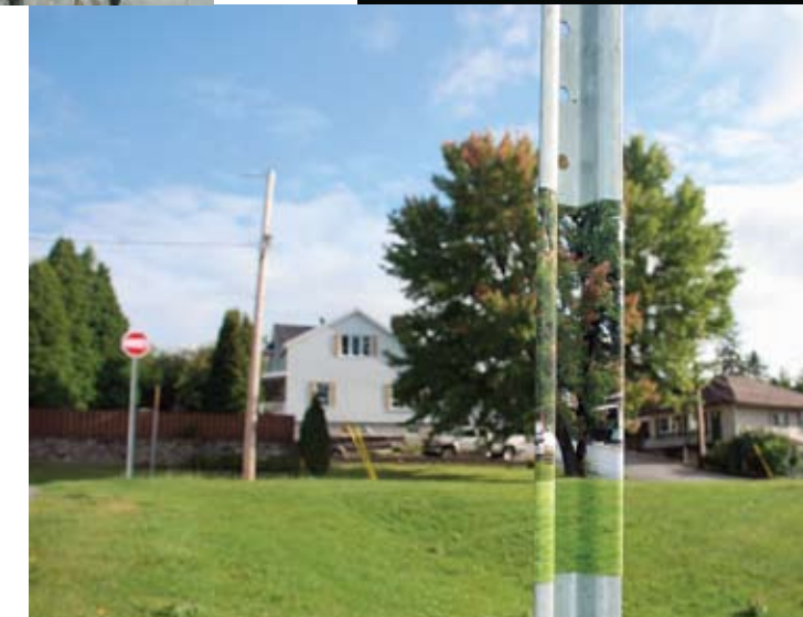
Émilie Rondeau, Obstructions, 2008