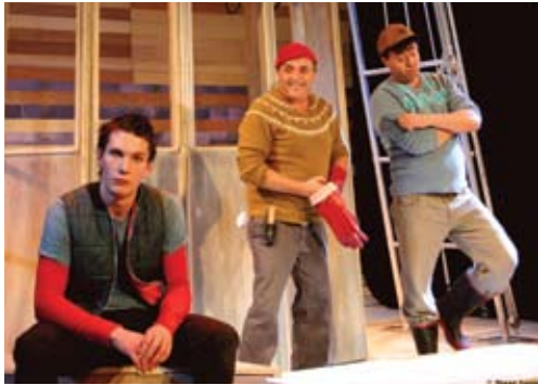
Théâtre les gens d'en bas

Théâtre Outremont 1248, rue Bernard Ouest 514 495-9944