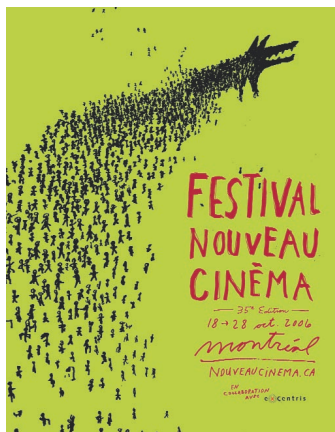
Affiche de la 35 e édition du Festival du nouveau cinéma

• Festival Fantasia qui, depuis 10 ans, est devenu le chef de file dans la promotion et de la diffusion des films de science-fiction - 10 000 $