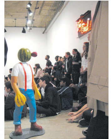
Rencontres avec des groupes scolaires au Centre d'art et de diffusion Clark © Centre Clark, 2006.

Pour accompagner l'événement Espace mobile, une série d'activités innovatrices pour les jeunes de 12 à 18 ans sur l'utilisation des technologies mobiles à des fins artistiques - 10 000 $