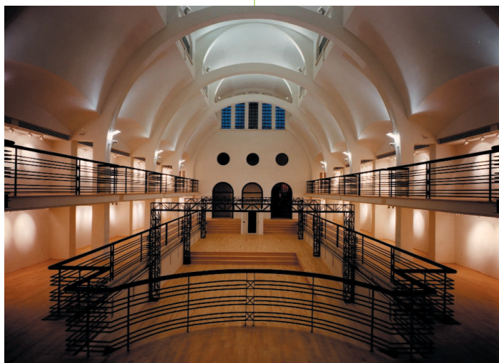
Salle d'exposition de l'Écomusée du fier monde dans l'ancien Bain Généreux © Écomusée du fier monde.