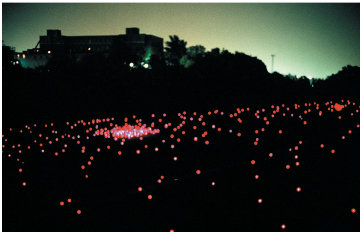
BEAULIEU, Patrick, Cherche étoiles , 1000 lueurs dans le territoire de Yamaska, 2004

Projet réalisé dans le cadre du programme de résidence et d'art public du centre d'essai en arts visuels 3 e - impérial et présenté à la maison de la culture Notre-Dame-de-Grâce