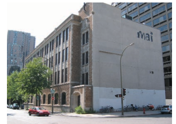
Le 3680, rue Jeanne-Mance, propriété municipale, et son principal occupant le MAI.

Découverte théâtrale en collaboration avec les diffuseurs municipaux de 4 arrondissements - 25 000 $