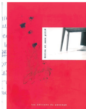
Livre réalisé dans le cadre du projet Sortir de la rue et marcher vers la vie (Collectif de femmes, Écrire et sans pitié , Les Éditions du passage, Montréal, 2006, 178 pages.)

Faire découvrir le documentaire à des jeunes par une série d'ateliers les initiant aux diverses facettes de la vidéo et du reportage en collaboration avec l'ONF - CinéRobothèque de Montréal - 6 000 $