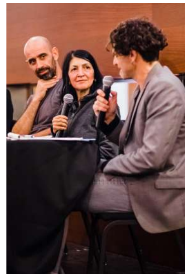
Table ronde Les enjeux de l'intégration dans le milieu de l'art et la culture , 30 novembre 2017.

28 – 29 novembre : Rencontre des Cités interculturelles organisée par le Conseil de l'Europe et la Ville de Lisbonne à Lisbonne au Portugal.