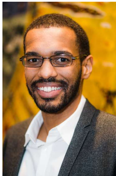
Le président du CIM, Moussa Sène

Le CIM a produit plusieurs documents de travail en 2017 en plus d'entamer un travail de réflexion important autour de la réalisation de deux avis qui seront déposés en 2018. En effet, le Conseil interculturel de Montréal a notamment produit un avis faisant le bilan, 10 ans plus tard, de son avis sur le profilage racial de 2006. Le CIM s'est aussi engagé dans la production d'un avis sur la participation citoyenne des personnes issues de la diversité et d'un mémoire en faveur d'une politique interculturelle pour la Ville de Montréal.