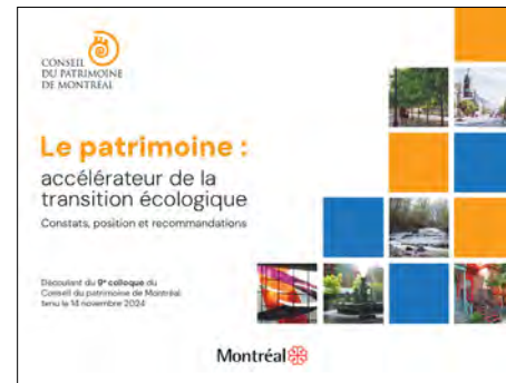
Ci-dessus : Page couverture du rapport « Le patrimoine : accélérateur de la transition écologique »

Le CPM encourage la réduction de l'empreinte environnementale des projets par l'adoption d'une approche circulaire fondée sur la réutilisation et la transformation des immeubles patrimoniaux. Il est même d'avis que la quantité de GES évitée par la conservation et la requalification du patrimoine devrait être mesurée pour tous les projets. En 2025, il a publié des recommandations sur la contribution écologique du patrimoine dans le rapport ci-contre.