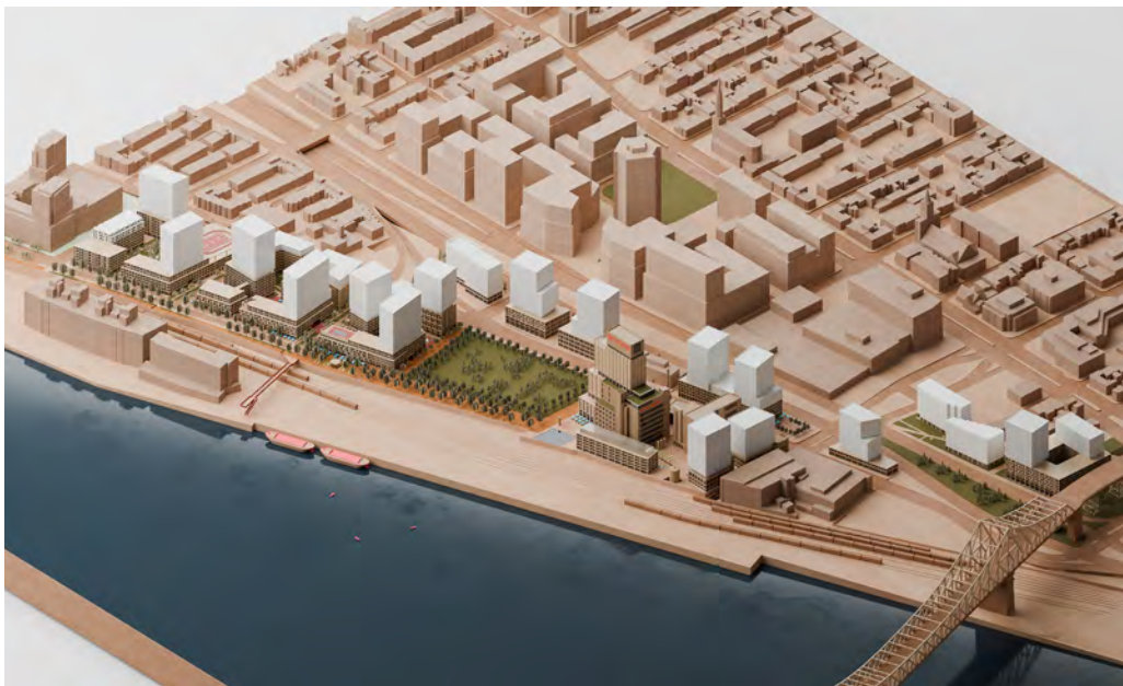
Ci-dessus : Vue conceptuelle du Quartier Molson – Client : Montoni & Fonds immobilier de solidarité FTQ – Sid Lee Architecture & Bolide Crédit: © Sid Lee Architecture

Lire l'avis du CPM sur le 2055, rue Drummond (ancien Winter Club)