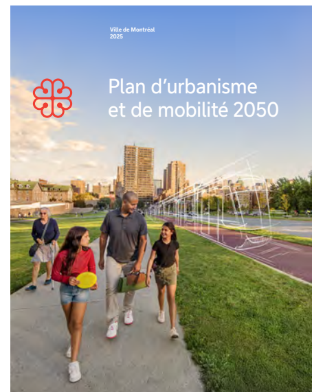
Ci-dessus : Plan d'urbanisme et de mobilité 2050

Lire l'avis du comité mixte sur le PUM 2050