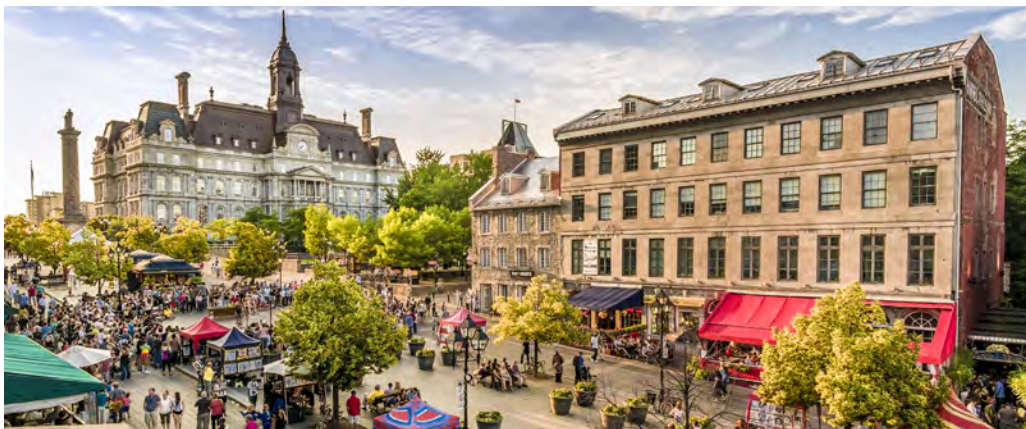
Ci-dessus : Place Jacques-Cartier, Vieux-Montréal

Lire l'avis sur le 339-349, rue Saint-Paul Est