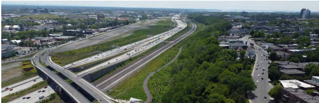
Ci-dessous : Site du futur parc-nature de l'écoterritoire de la falaise

Lire l'avis du CPM sur le réaménagement de l'avenue Henri-Julien