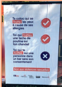
Campagne d'affichage contre les violences sexuelles.