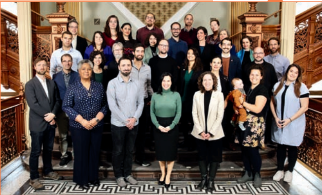
Les membres du comité d'orientation de Transition en commun en compagnie de la mairesse Valérie Plante.