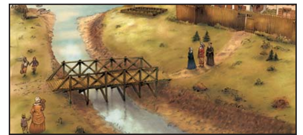
Illustration : Jean-Paul Eid

Nous partons en mini-excursion sur les traces de Françoise et des premiers Montréalais, dans un parcours qui nous amène à longer la place D'Youville, du Centre d'histoire à la place Royale.