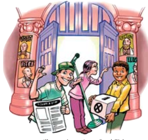
Illustration : Jean-Paul Eid