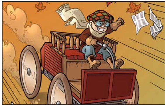
Illustration : Benoît Godbout

Spécialement dessinées pour eux, de grandes images piqueront la curiosité des jeunes. Dans chaque salle, le guide y puisera des histoires mettant en scène des enfants et des moyens de transport . Et, dans le dépliant de la visite, les jeunes trouveront des jeux et des dessins à compléter.