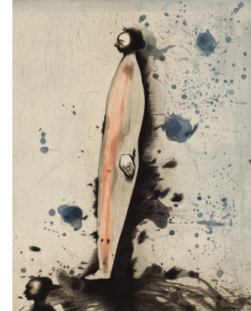
LOUIS-PIERRE BOUGIE, DEUX PETITS PROFILS, AQUATINTE ET BURIN, 1990

Visites pour le grand public avec le galeriste et collectionneur Éric Devlin Jeudi 4 mai à 13 h 30 Jeudi 4 mai à 19 h