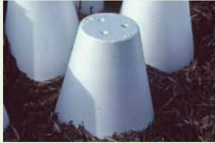
Cône de protection - Jardin botanique de Montréal (Jean-Pierre Bellemare)

Cela empêche la formation de canaux de rongeurs entre le sol et la neige et détruit les canaux existants. On peut utiliser la même méthode pour prévenir les dommages à la pelouse;