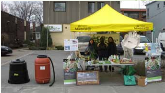
kiosque de sensibilisation