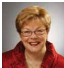
Monique Worth Maire d'arrondissement

Plus généralement, c'est sur l'ensemble du territoire métropolitain que des gestes sont posés en faveur de l'activité économique, de la mise en valeur de la nature, des transports en commun, d'une offre culturelle toujours plus diversifiée, tout cela dans l'optique d'offrir aux familles la meilleure qualité de vie. Profitez-en!