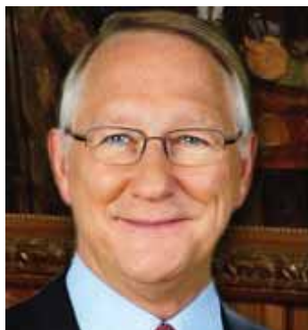
Gérald Tremblay Maire de Montréal