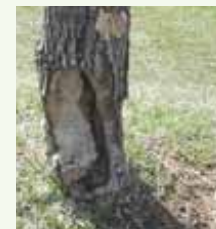
Les blessures répétées causées par les outils de tonte mettent en péril la survie des arbres.

Comme vous le savez sans doute, les arbres sont des organismes forts et fragiles en même temps. Ils sont appréciés pour leur ombre rafraîchissante, leurs valeurs ornementales et écologiques. Malheureusement, plusieurs d'entre eux souffrent de mauvais traitements souvent affligés par les jardiniers eux-mêmes.