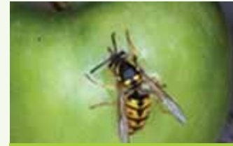
Guêpe sociale : contrairement aux guêpes de sable, elle peut piquer. Elle vole autour des poubelles et convoite votre pique-nique.

sectes utiles dans les parcs n'est pas envisagée. Toutefois, la Ville de Montréal teste depuis 2010 des méthodes de tamisage pour contrôler les populations. Peut-être verrez-vous l'équipe de recherche à l'œuvre dans un parc de l'arrondissement cet été. N'hésitez pas à aller poser vos questions, vous en apprendrez davantage sur ces insectes fascinants.