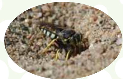
Guêpe de sable ( Bicyrtes quadrifasciatus )

Dans la nature, ces guêpes sont d'importantes prédatrices d'insectes. Chaque femelle en chasse près de 15 000 pour nourrir sa progéniture! De plus, elles pollinisent un grand nombre de plantes.