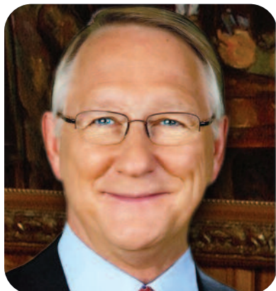
Gérald Tremblay Maire de Montréal

Vivre à Montréal, c'est choisir un mode de vie compatible avec les besoins des familles d'aujourd'hui. Des familles qui grandissent et évoluent tout en demeurant attachées à leur quartier, à leur arrondissement. Pierrefonds-Roxboro s'inscrit parfaitement dans cette vision, avec une programmation et des équipements de qualité, dédiés autant aux sports et aux loisirs qu'à la culture et aux arts.