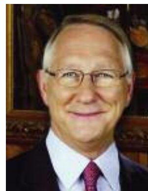
Gérald Tremblay Maire de Montréal

Les édifices municipaux seront fermés les lundis 7 septembre (Fête du travail) et 12 octobre (Action de grâces).