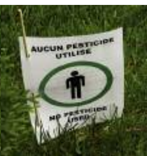
Attention! Cette affiche ne dit pas toujours la vérité.

Pour valider une application de pesticides sur un terrain, contactez la Ligne Verte de l'arrondissement. Il en va de votre sécurité.