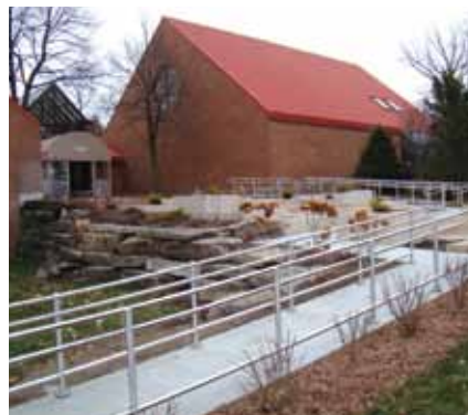
L'entrée ouest de la mairie d'arrondissement est maintenant accessible aux personnes à mobilité réduite.

De plus l'automne dernier, nous avons mis en place une plateforme interactive pour faciliter le covoiturage pour les employés de l'arrondissement ainsi que pour les citoyens. À l'usage, les citoyens peuvent vite constater comment ce service leur est utile, non seulement pour leurs déplacements dans l'arrondissement de Pierrefonds-Roxboro, mais aussi pour des trajets plus longs, partout au Québec, au Canada et même aux États-Unis.