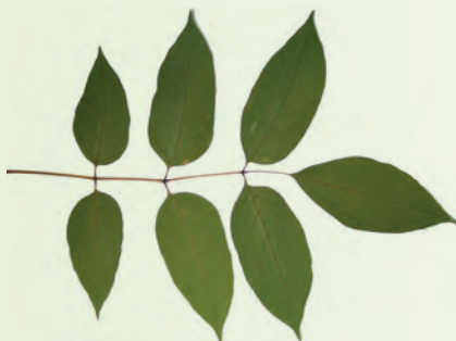
Feuilles de frêne

Rappelons que la forêt urbaine de Montréal est constituée d'environ 20 % de frênes publics, sans compter les frênes privés, et que l'agrile menace tous les frênes, sains ou dépérissants, matures ou jeunes. Ces arbres contribuent significativement à la qualité de l'environnement urbain. La perte de milliers de frênes aurait un impact non négligeable sur la qualité de l'air, de l'eau ainsi que sur la valeur des propriétés adjacentes et la santé des citoyens (voir article sur les services rendus par les arbres).