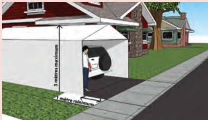
Illustration : Éric Massie