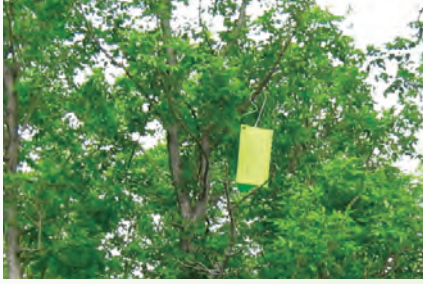
Piège pour l'agrile du frêne

Pour plus de renseignements sur l'agrile du frêne et les symptômes d'infestation, visitez le site Internet de la Ville de Montréal : ville.montreal.qc.ca/agrile ou de l'ACIA : inspection.gc.ca