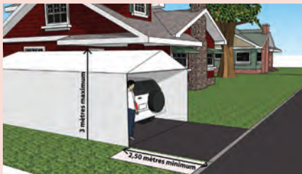
Illustration : Éric Massie

Veillez noter que le non respect de la réglementation sur les abris temporaires constitue une infraction par condition non respectée et est passible d'une amende.