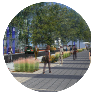
Vue projetée du boulevard Pie-IX

La requalification du boulevard Pie-IX prendra appui sur plusieurs grands projets d'infrastructures : le réaménagement du carrefour Henri-Bourassa—Pie-IX, l'aménagement de la gare de Montréal-Nord et l'implantation du service rapide par bus (SRB).