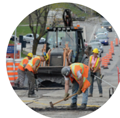
Début des travaux préparatoires sur le boulevard Pie-IX

La Charte de la Ville de Montréal permet au CCU d'agir à titre de comité d'étude des demandes de démolition.