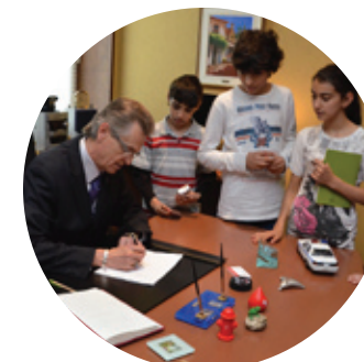
Activité « Mairesse ou maire d'un jour »

514-328-4000, poste 4024 Télécopieur : 514-328-5577 gilles.deguire@ville.montreal.qc.ca