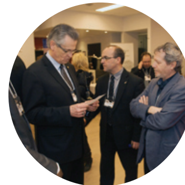
Rendez-vous entrepreneurial de l'arrondissement à l'école d'hôtellerie Calixa-Lavallée

Le Secrétariat d'arrondissement – greffe et archives fournit le soutien essentiel à la tenue et au suivi des assemblées du conseil d'arrondissement. Il rédige les règlements, les résolutions et autres documents, organise la tenue de consultations publiques, de référendums et d'élections, le cas échéant, et gère les archives de l'arrondissement. Il répond également aux demandes d'accès à l'information.