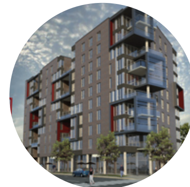
Futur projet résidentiel Maxéra sur le boulevard Pie-IX