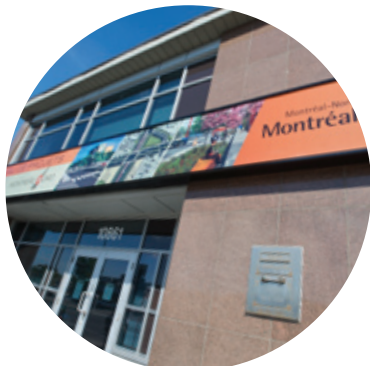
Bureau de projets, 10861, boulevard Pie-IX