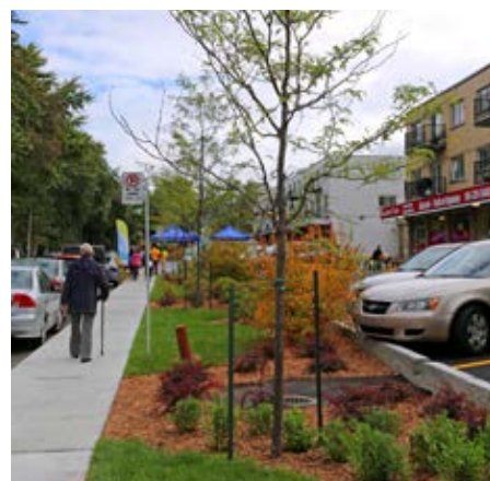
Les Places Del Sol et Le Pascal sont maintenant aménagées d'espaces verts et de repos pour le plaisir des citoyens et des commerçants.

a été accordée au verdissement. De plus, cette transformation a été réalisée avec la participation active de nombreux citoyens du secteur, dont les productions artistiques, inscrites dans des dalles de pavé uni, se sont intégrées au mobilier urbain.