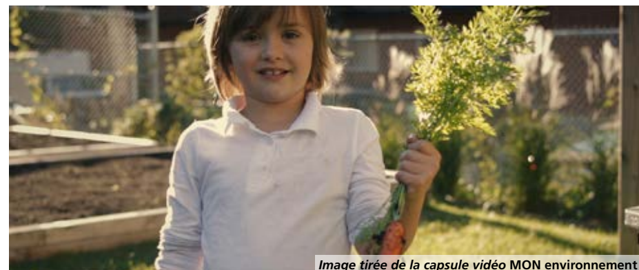
Image tirée de la capsule vidéo MON environnement