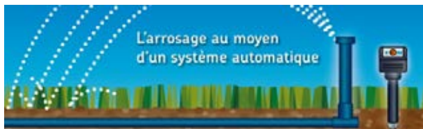
L'arrosage au moyen d'un système automatique