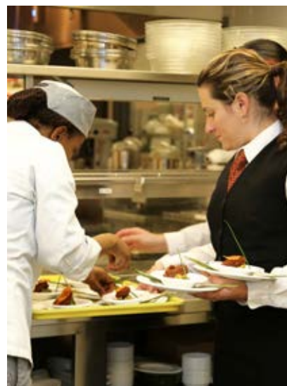
Un souper gastronomique aura lieu le 30 mai dans le cadre du volet Arts de la table.

Profitez-en pour faire des découvertes culturelles... C'est tout près de chez vous, et c'est gratuit !