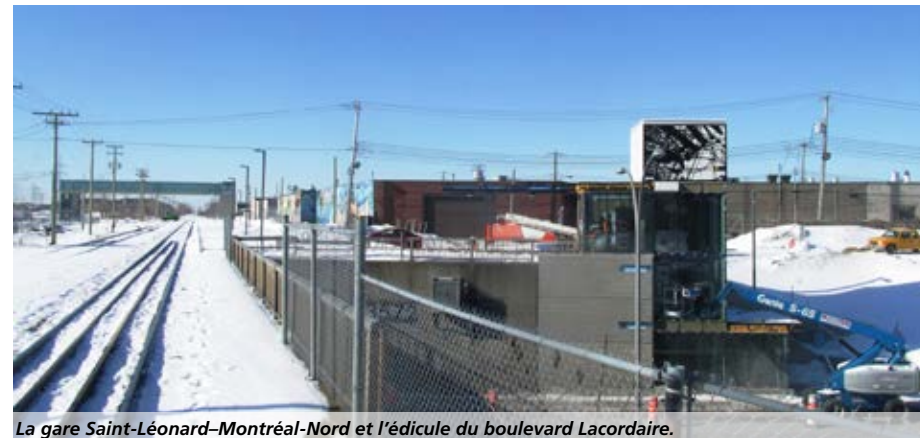
La gare Saint-Léonard–Montréal-Nord et l'édicule du boulevard Lacordaire.