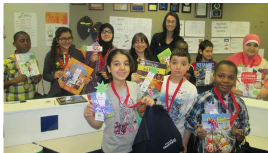
Les fiers gagnants de la médaille de bronze au jeu-questionnaire Les Petits génies , les équipes des bibliothèques Belleville et de la Maison culturelle et communautaire, les Bolés et les Champions.

finale interbibliothèques qui était organisée à l'occasion du congé scolaire. Les quatre meilleures équipes se sont affrontées dans un match final, le 6 mars. Devant une salle bondée, l'équipe des Génies en herbe de la bibliothèque Henri-Bourassa a remporté la médaille d'or et l'équipe Œil de lynx de la bibliothèque Charleroi, celle d'argent, alors que les équipes des bibliothèques Belleville et de la Maison culturelle et communautaire, les Bolés et les Champions, ont remporté celle de bronze. Parents, amis et animateurs étaient tous très fiers de leurs jeunes. Nous félicitons l'ensemble des participants et nous invitons tous les jeunes intéressés à se joindre à nous l'an prochain.