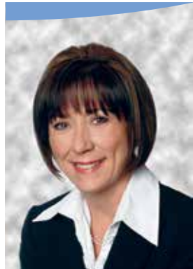
Manon Barbe Mairesse Mayor