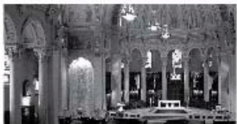
Détail du décor peint d'Ozias Leduc Detail of decoration painted by Ozias Leduc

Today, neither has been overlooked: Inside the church, the wall decoration painted by Ozias Leduc in the early 1930s re-echoes the theme of the Choir of Angels, in adoration of the Mystic Lamb, inspired by the Apocalypse of John, while a monumental statue of Archangel Saint Michael, a work of art attributed to sculptor Louis Jobin, crowns the top of the church.