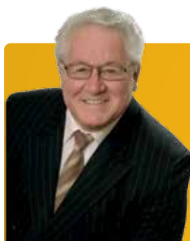
Gilles Beaudry Samedi 7 mars

Le conseil d'arrondissement convie les citoyens, les commerçants, les entreprises et les institutions à éteindre, par solidarité, toutes les lumières ce soir-là. Plus nous serons nombreux à participer, plus nous enverrons un message clair : agissons maintenant !