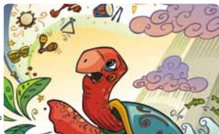
La grande tortue