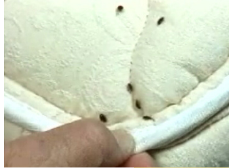
Des punaises de lit sur un matelas

Elles peuvent également se trouver dans n'importe quel objet qui leur offre un endroit sombre et étroit où elles peuvent facilement se dissimuler. Une fente de l'épaisseur d'une carte de crédit est suffisante pour constituer un abri pour les punaises de lit.