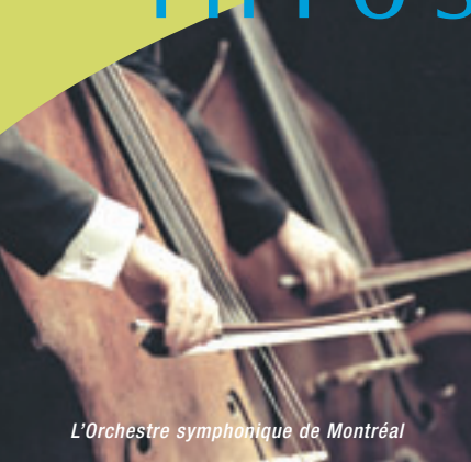
L'Orchestre symphonique de Montréal