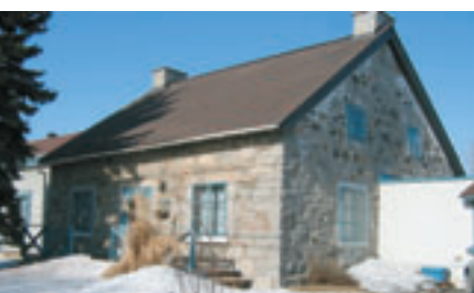
Le relèvement du rez-de-chaussée pallie à l'accumulation de neige.

Le Service de la mise en valeur du territoire et du patrimoine a procédé, au cours de 2007, au recensement des maisons de ferme sur le territoire montréalais. Il en a dénombré 172, parmi lesquelles 11 se situent dans l'arrondissement de Montréal-Nord.