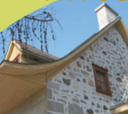
Le débordement du toit protège la maçonnerie et abrite la galerie.