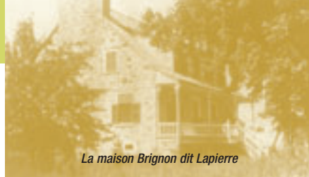
La maison Brignon dit Lapierre