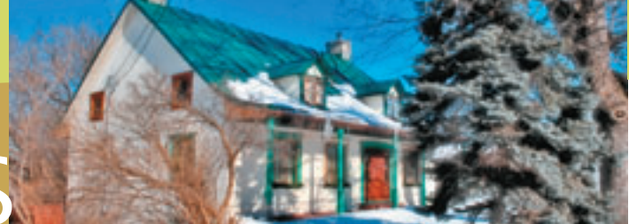
L'ajout de lucarnes éclairent les combles dorénavant habitables.