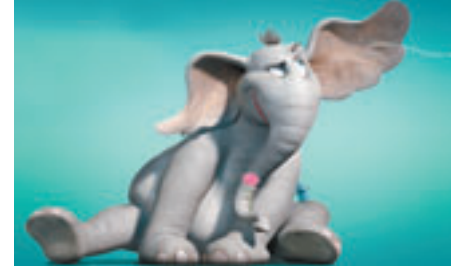
Horton entend un qui !