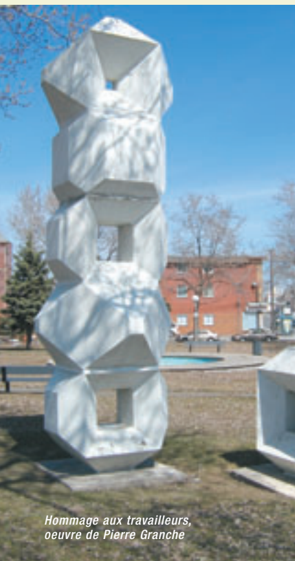
Hommage aux travailleurs, oeuvre de Pierre Granche