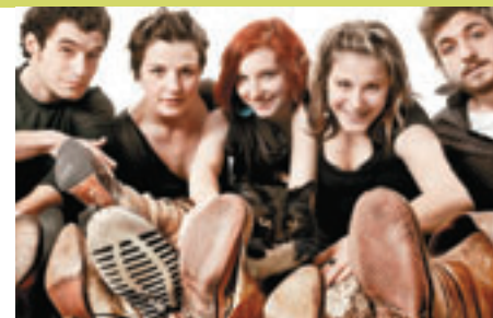
Le chat botté, photo : Christian Blais

Renseignements relatifs à l'exposition : 514-328-5640 ville.montreal.qc.ca/mtlnord