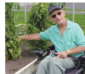
Des jardinets adaptés sont offerts aux jardins Maisonneuve et Souigny.

(Pavillon des Archers, parc Pierre-Bédard, 5515, rue Lacordaire) 514 252-8315 ou 872-5991