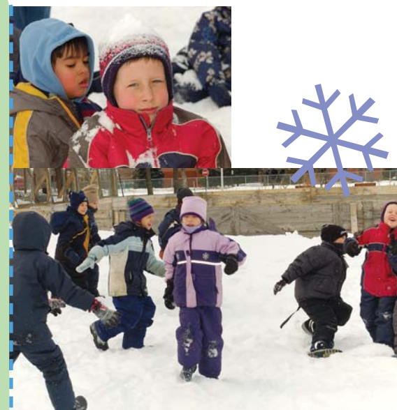
Une activité du camp de jour de la semaine de relâche 2005 du centre de loisirs St-François-d'Assise.