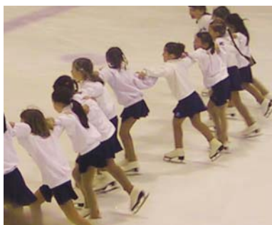
Des athlètes croquées sur le vif lors des Jeux 2005.

Pour participer aux Jeux de Montréal, tu dois être inscrit au préalable dans l'une des disciplines sportives offertes par le centre de loisirs situé près de chez vous. Pour obtenir la liste des activités sportives dans lesquelles tu peux concourir, consulte le journal de l'arrondissement MHM vous informe d'automne 2005 ou communique avec ton centre de loisirs.