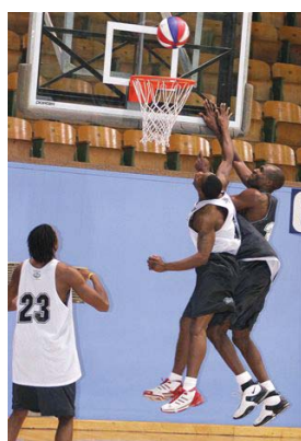
Les joueurs de basket-ball du Matrix en action.

Pour connaître le calendrier des parties et pour vous procurer des billets, vous devez vous adresser au centre Pierre-Charbonneau en téléphonant au 514 872-6644 . On peut aussi se procurer des billets en ligne à l'adresse www.monbillet.ca ou via le site Web : www.montrealmatrixbasketball.com