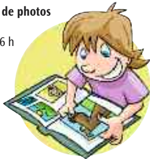
Table de développement social de LaSalle