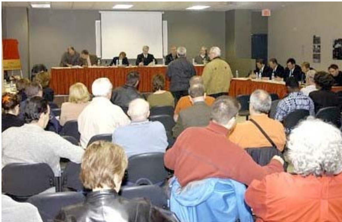
La salle est placée comme sur la photo.