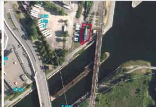
Lot occupé par la tour