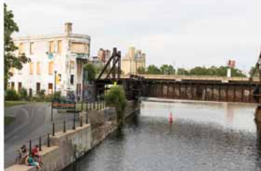
Tour d'aiguillage Wellington