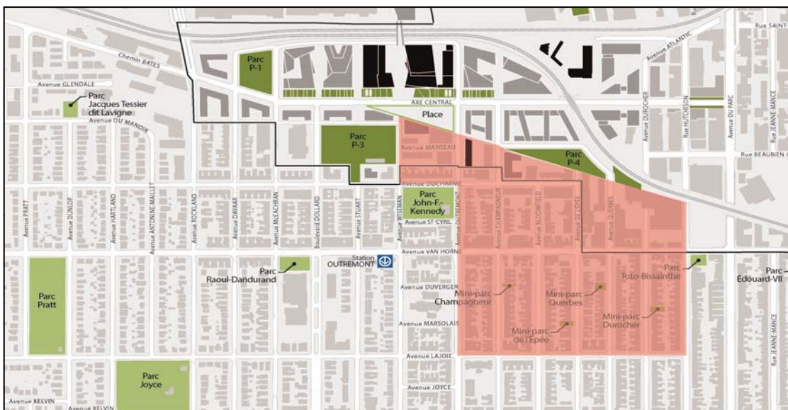
Figure 2_Périmètre d'envoi des invitations aux citoyens

La vocation du parc P-4a étant celle d'un « parc de voisinage », la Ville a convié les citoyens résidant à proximité à un atelier de participation citoyenne portant sur l'aménagement du futur lieu public. Ainsi, plus d'un millier d'invitations ont été transmises aux citoyens, par voie postale, au sein du périmètre d'envoi illustré ci-dessous. Finalement, 25 citoyens ont participé à l'atelier du 15 mars 2017.