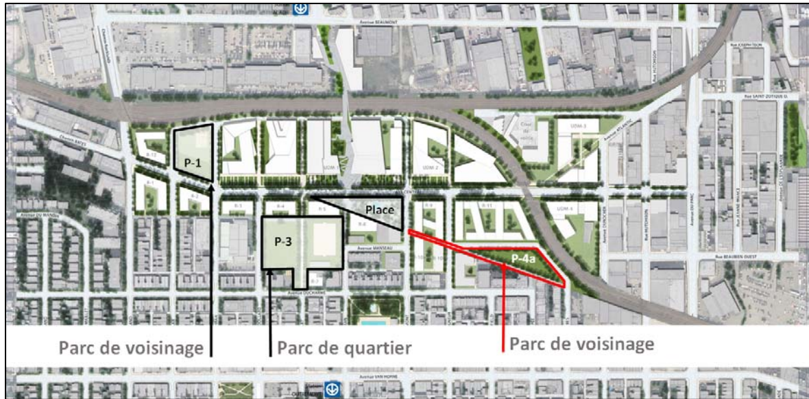
Figure 1_Lieux publics du site Outremont

Outre la construction des pavillons universitaires de l'Université de Montréal et des ensembles résidentiels, quatre nouveaux lieux publics seront aménagés au sein du projet du site Outremont : une place publique, deux parcs de voisinage (P-1 et P-4a) et un parc de quartier (P-3). Faisant partie de la présente démarche d'aménagement, le parc P-4a a une superficie d'environ 7 600 m 2 . Il est situé à l'extrémité sud-est du site, entre les avenues Querbes et Champagneur. Sa limite sud-est définie par l'ancienne emprise de chemin de fer qui traverse le site en diagonale.