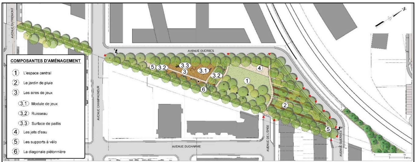
Figure 4 _Plan concept de la proposition B

Au cours de cette soirée, les professionnels de la Ville de Montréal, accompagnés des consultants chargés de la conception du parc, ont animé la séance d'atelier. L'objectif était de communiquer les grandes intentions d'aménagement de ce nouveau lieu public, mais également de faire participer les citoyens à l'élaboration du design souhaité du futur parc. Les discussions ont notamment permis d'aborder les thématiques suivantes : la programmation et les aires de jeux, la diversité végétale, le mobilier et l'éclairage, etc. Les contributions citoyennes permettront de guider les concepteurs du parc dans l'élaboration d'une proposition d'aménagement finale. Une deuxième activité publique sera organisée à la fin du mois de mai 2017 pour confirmer les attentes citoyennes à l'égard du concept d'aménagement final du parc.