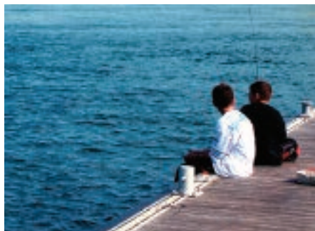
ILLUSTRATION 2.7.1 LA QUALITÉ DE L'EAU EN RIVE – 2003