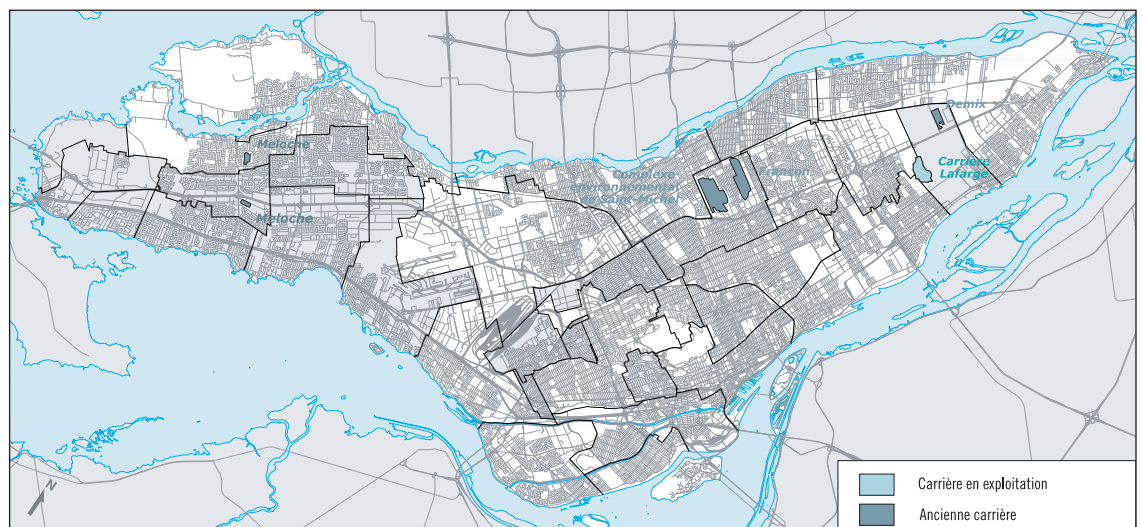
ILLUSTRATION 2.7.4 LA CARRIÈRE LAFARGE ET LES ANCIENNES CARRIÈRES

La Ville de Montréal possède aussi les anciennes carrières Francon et Demix. La première, sise dans l'arrondissement de Villeray–Saint-Michel–Parc-Extension, sert de site de dépôt des neiges usées. La seconde, localisée dans l'arrondissement de Rivière-des-Prairies–Pointe-aux-Trembles–Montréal-Est, est utilisée pour l'enfouissement des cendres produites par l'incinération des boues résiduelles de la station d'épuration des eaux usées de la Ville.